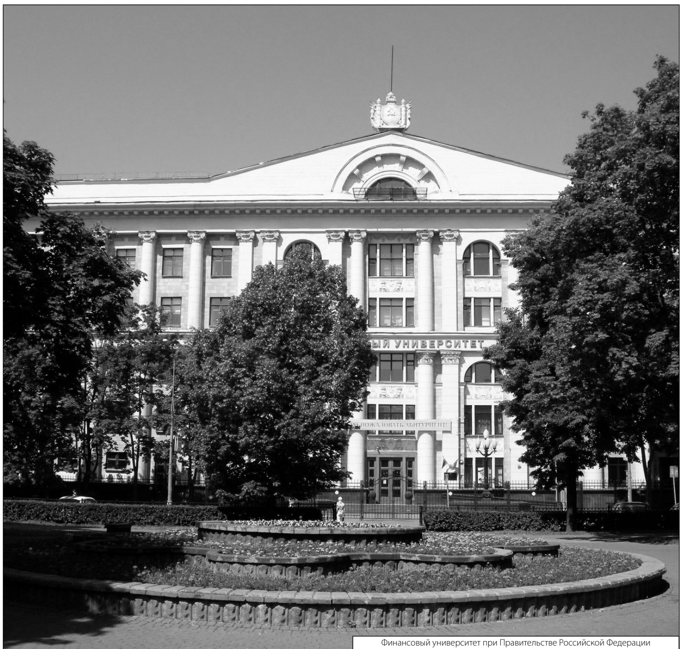
Финансовый университет при Правительстве Российской Федерации

© Данилова Вероника Валерьевна (v.danilova@omprussia.ru). Журнал «Современная наука: актуальные проблемы теории и практики»