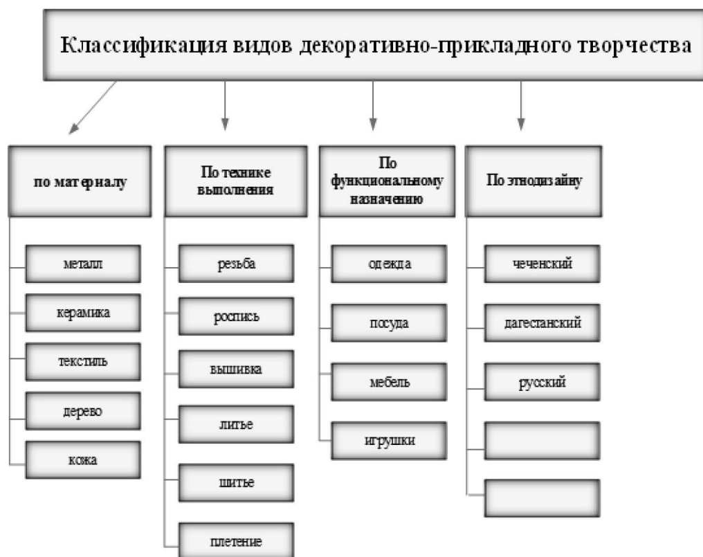
Рис.1. Классификация видов декоративно прикладного творчества