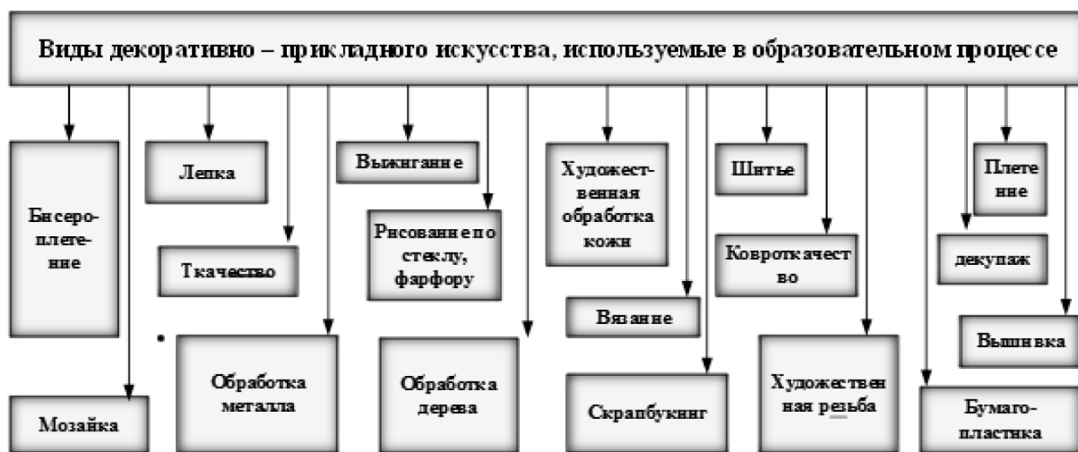
Рис. 2. Виды декоративно-прикладного творчества, используемые в подготовке будущих учителей технологии

Ткачество – это ремесло, при котором создаются ткани различной фактуры. Основными материалами для данного вида ДПИ являются нити, полученные из растений, шерсти животных или синтетическим путем. Для создания текстуры используется техника, при которой нити переплетаются по вертикали и горизонтали. Процесс переплетения нитей происходит при помощи ткац-