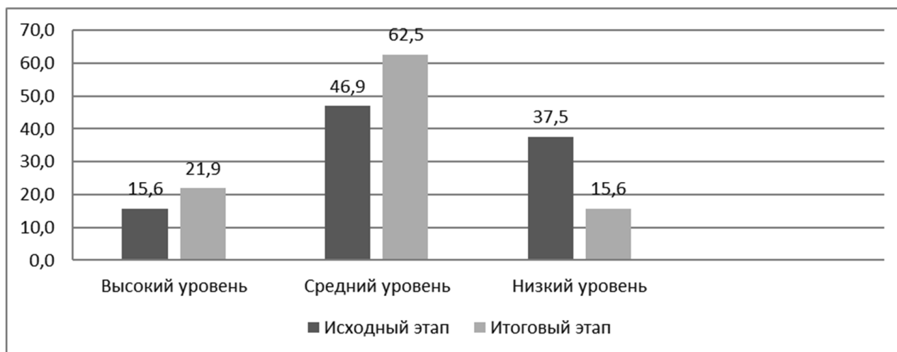
Рис. 1. Изменение уровня коммуникативного контроля будущих водителей

Условные обозначения: КК – коммуникативный контроль, РпС – регуляция при стрессе, К – конфликтность.