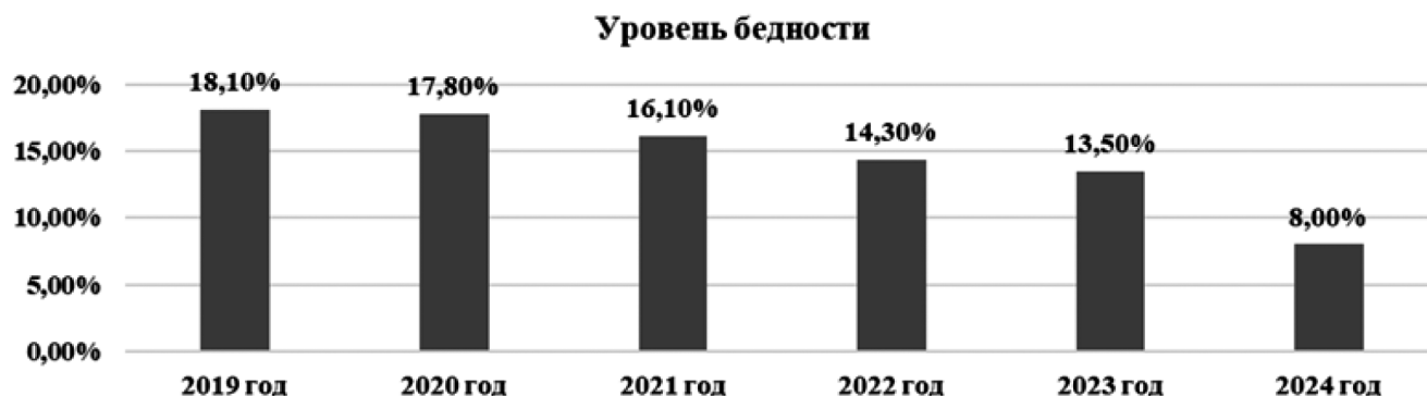
Рис. 1. Динамика уровня бедности в Кемеровской области — Кузбассе за 2020–2024 гг.