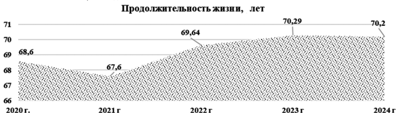
Рис. 3. Динамика продолжительности жизни в Кемеровской области — Кузбассе за 2020–2024 гг., лет