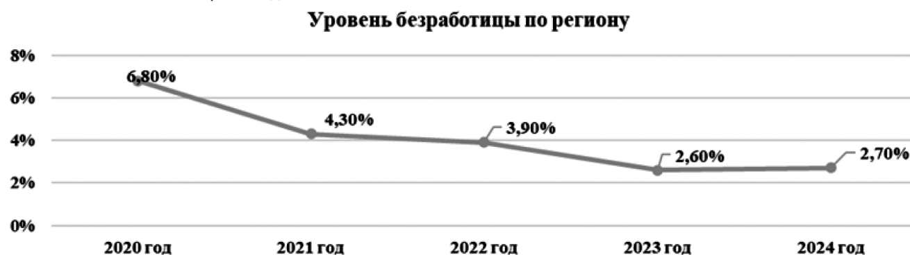
Рис. 5. Динамика уровня безработицы в Кемеровской области за 2020–2024 гг.