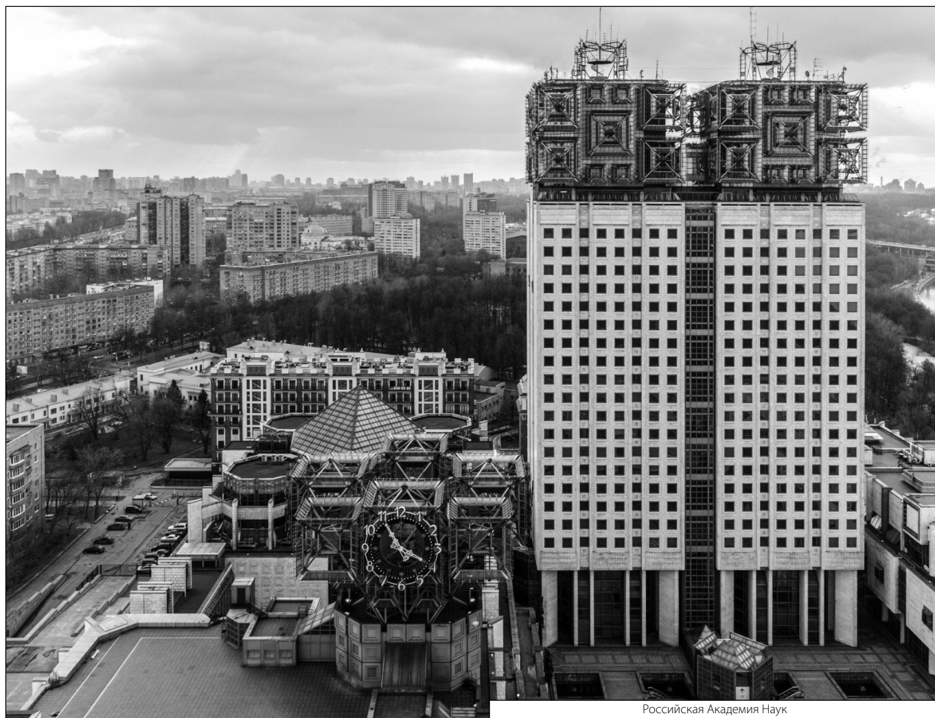
Российская Академия Наук

Журнал «Современная наука: актуальные проблемы теории и практики»