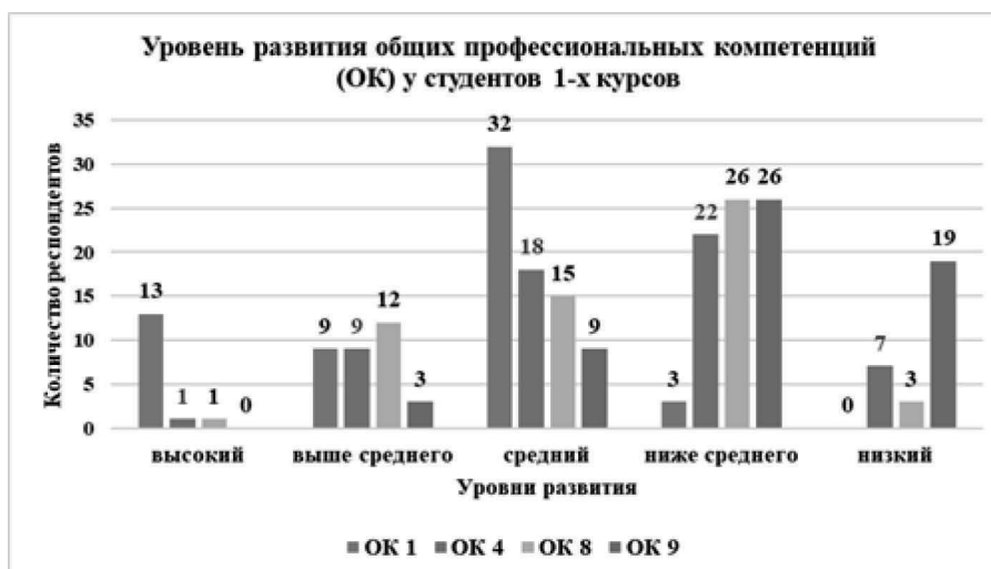
Рис. 2. Результаты диагностики уровня развития ключевых общих компетенций у студентов первого года обучения