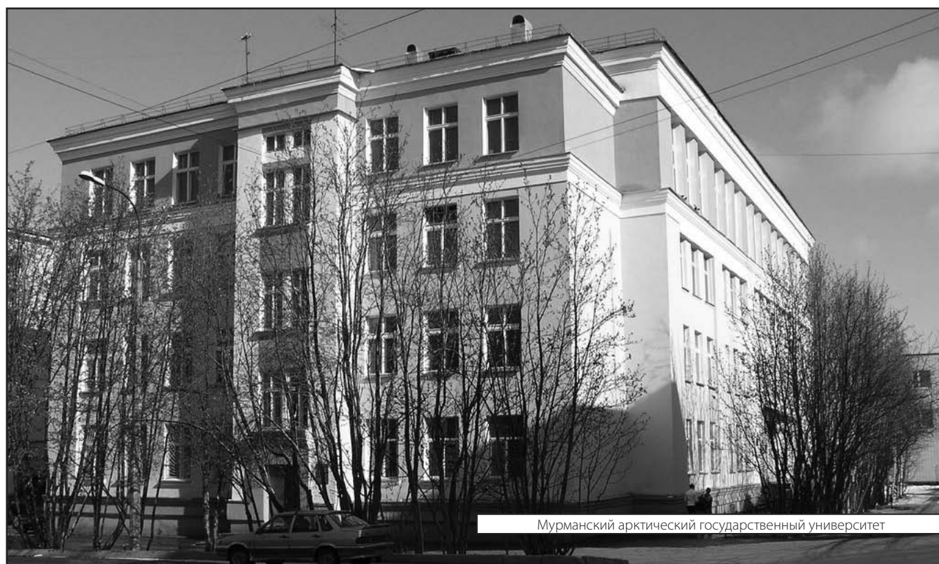
Мурманский арктический государственный университет

Журнал «Современная наука: актуальные проблемы теории и практики»