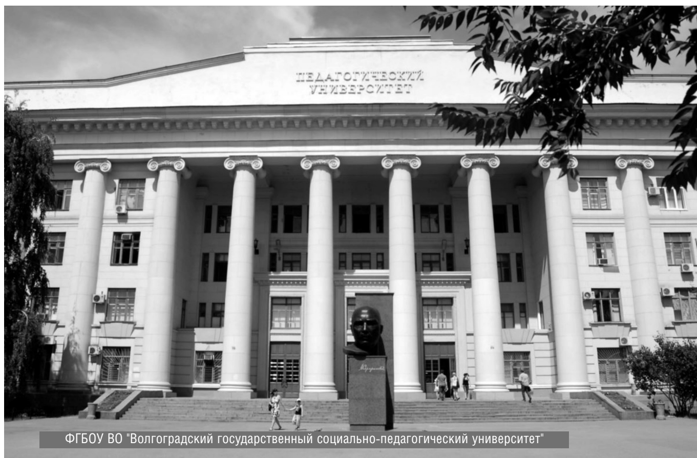
ФГБОУ ВО "Волгоградский государственный социально-педагогический университет"

© Н.В. Ляшенко, И.В. Арановская, ( Lnv.vgiiik@yandex.ru ), Журнал «Современная наука: актуальные проблемы теории и практики»,