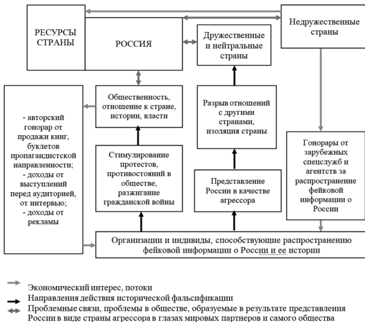
Рис. 2. Схема получения экономической выгоды от фальсификации исторических данных о России и СССР

цидент является примером тенденции использования исторических фактов с целью поддержания доминирования одной страны, не учитывая стремления к созданию многополярного мира [5].