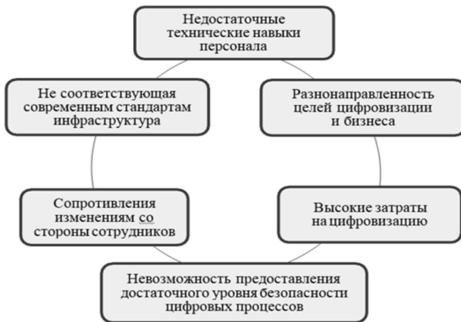
Рис. 1. Барьеры цифровизации отечественных промышленных предприятий

О.Н. Миркина и соавторы предлагают следующую классификацию барьеров, создающих препятствия для успешной цифровизации отраслей отечественной экономики (рис.1.).