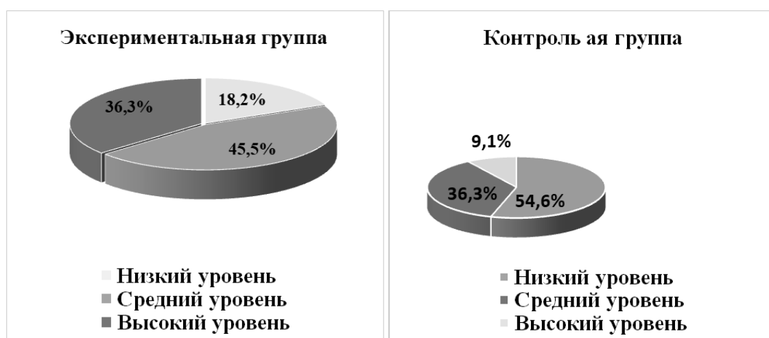
Рис. 2. Распределение старших дошкольников с общим недоразвитием речи экспериментальной и контрольной групп по уровню сформированности грамматического строя речи (по результатам контрольного эксперимента)

Сравнительный анализ результатов контрольного эксперимента подтвердил эффективность применения игр с лэпбуком в логопедической работе по формированию грамматического строя речи дошкольников с общим недоразвитием речи. Так, испытуемые экспериментальной группы продемонстрировали более высокий уровень сформированности грамматических умений: образовывать и употреблять грамматические формы и конструкции; анализировать структуру предложений, распознавать грамматические ошибки и осуществлять их верификацию. Среди них было на 27,2 % больше де-