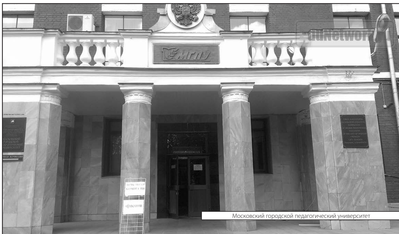
Московский городской педагогический университет

Журнал «Современная наука: актуальные проблемы теории и практики»