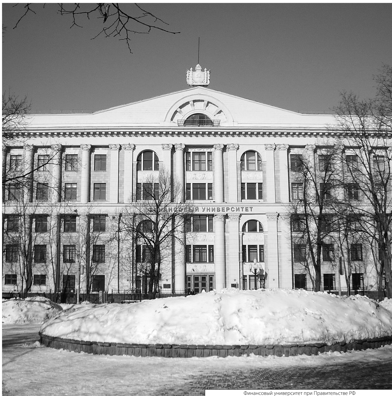
Финансовый университет при Правительстве РФ

Журнал «Современная наука: актуальные проблемы теории и практики»