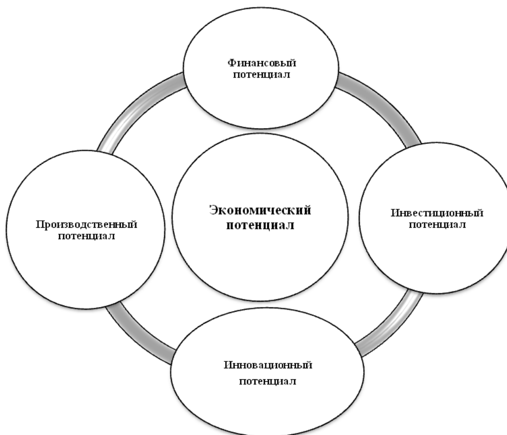
Рис. 1. Комплексная цикл-схема компонентов экономического потенциала.

Представим определения, что подразумевается под частными видом потенциала.