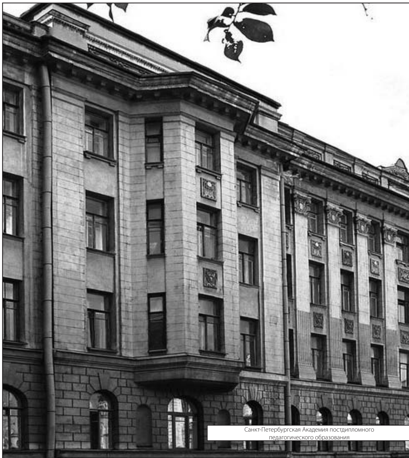
Санкт-Петербургская Академия постдипломного педагогического образования

© Боголепов Станислав Александрович (stanislav@vashsysadmin.ru). Журнал «Современная наука: актуальные проблемы теории и практики»