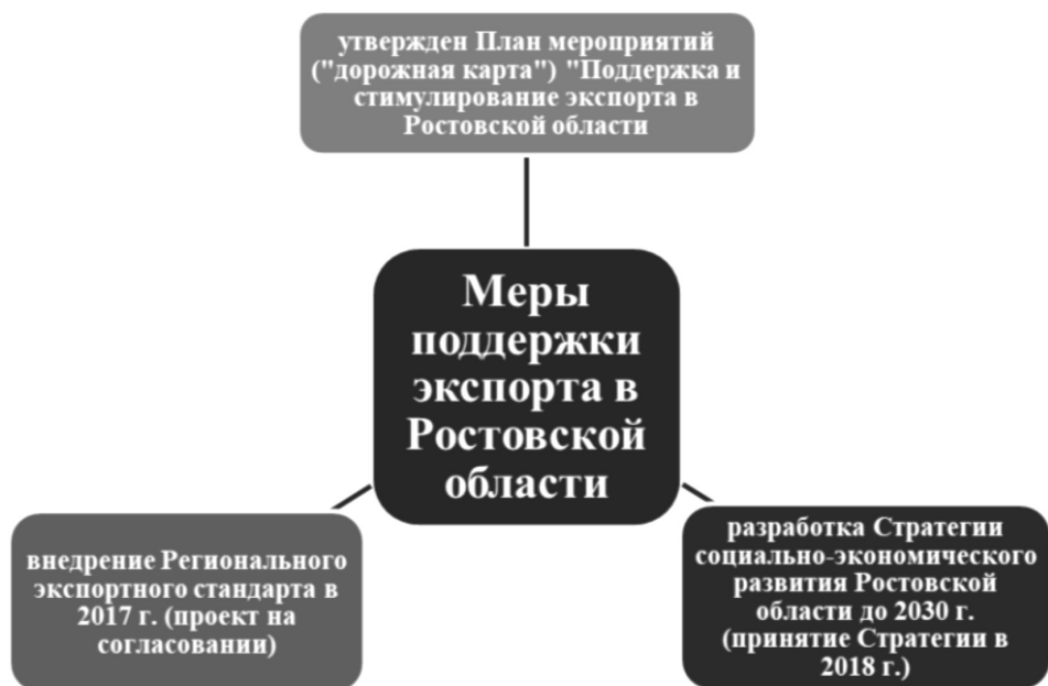
Рисунок 3. Системные меры государственной поддержки экспорта в Ростовской области.