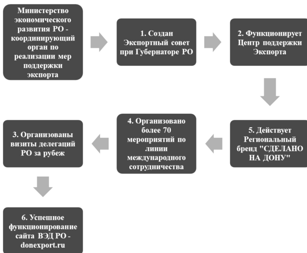
Рисунок 4. Мероприятия в рамках внедрения Регионального экспортного стандарта.