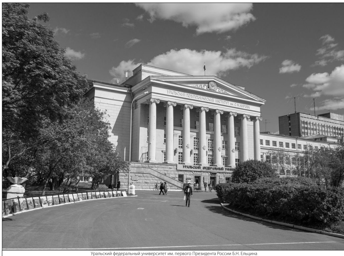
Уральский федеральный университет им. первого Президента России Б.Н. Ельцина

Журнал «Современная наука: актуальные проблемы теории и практики»