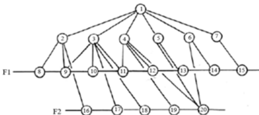
Рис. 2. Типовая структура информационных потоков в процессе управления системой вентиляции шахты

тивное влияние в разрезе всего иерархического управленческого контура.