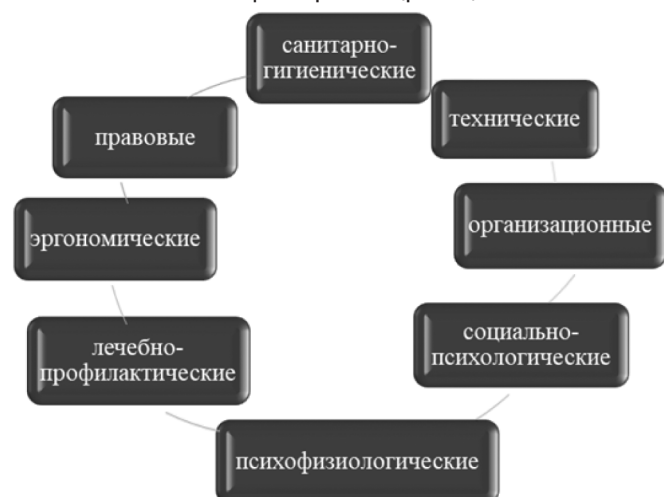
Рис. 2. Факторы безопасности труда работников

На безопасность здоровья и труда персонала оказывают влияние такие факторы как (рис. 2):