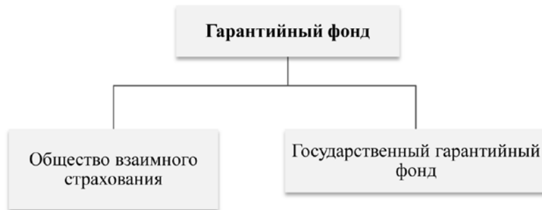
Рис. 4. Структура гарантийного фонда (составлено автором).

нодательной основе обязан выделять 1-5% от годовой прибыли уполномоченной кредитной организации, которая направляет выделенные средства МСБ, обслуживающему данный корпоративный бизнес;