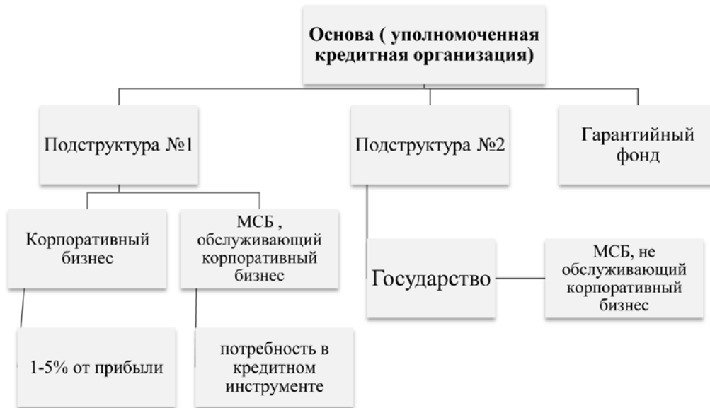
Рис. 3. Система финансирования, направленная на региональную приоритетность (составлено автором).