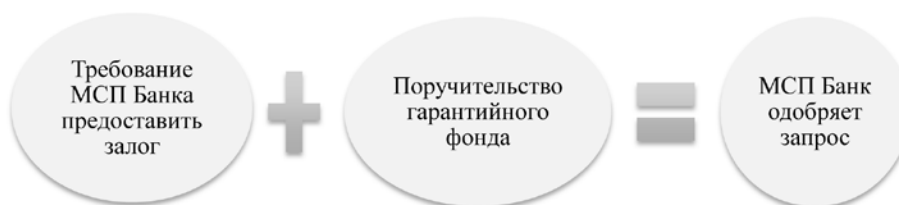
Рис. 1. Механизм взаимодействия МСП Банка с Гарантйным фондом (составлено автором).