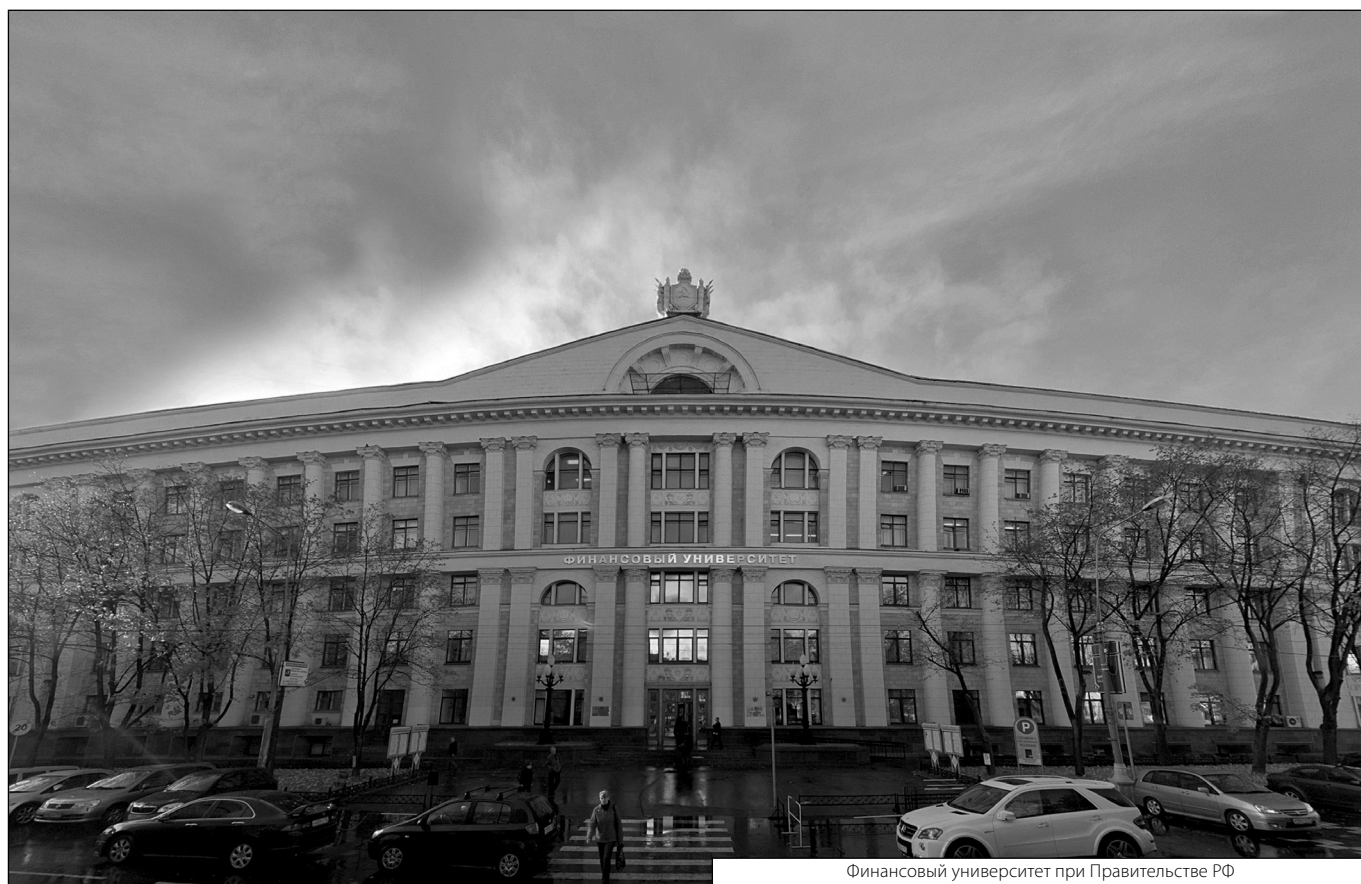
Финансовый университет при Правительстве РФ

Журнал «Современная наука: актуальные проблемы теории и практики»