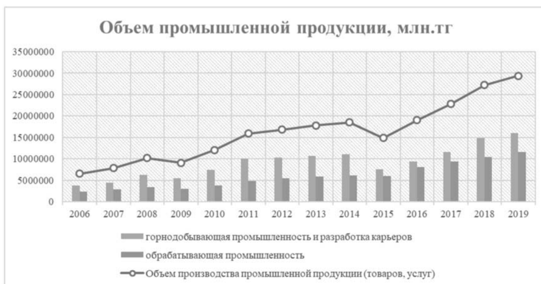
Рис. 2. Динамика объемов производства промышленной продукции