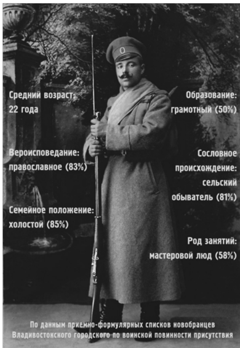
Рис. 3. Социальный портрет новобранца–приамурца в годы Первой мировой войны