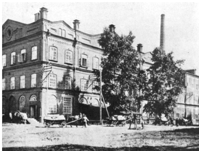
Завод братьев Крестовниковых

Как показано нами выше, русское население было самым многочисленным на территории губернии. Специфической чертой губернского рынка был его "...территориально-экономический раздел...между татарскими и русскими предпринимателями".[7;159]