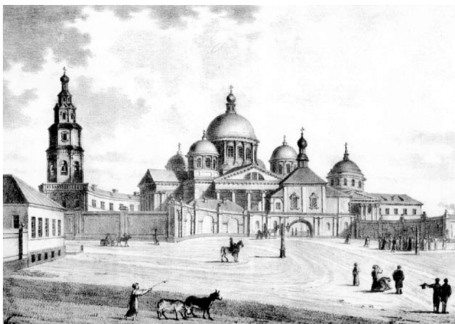
Казань. Казанско-Богородицкий монастырь.

Л.М. Свердлова выделила специфические черты словесной структуры Казанской губернии, указав, что другой важной "особенностью Казанской губернии является преобладание государственных крестьян...".[7;28] Государственные крестьяне Казанской губернии, "татары, чуваша и русские", отличались экономической активностью, "пополняли ряды городского торгового люда, нанимались бурлаками и грузчиками, использовались в качестве... дешёвой наёмной силы для выполнения... неквалифицированной работы".[7;28-29] Таким образом, наличие дешёвой рабочей силы являлось ещё одной характерной чертой Казанской губернии.[12;485]