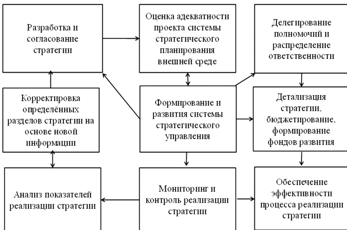
Рисунок 2. Процесс формирования и совершенствования системы стратегического управления организацией.

Также система стратегического планирования развития организации может строиться на различных подходах к участию руководителей и специалистов в процессе разработки стратегии. Отличительные особенности под-