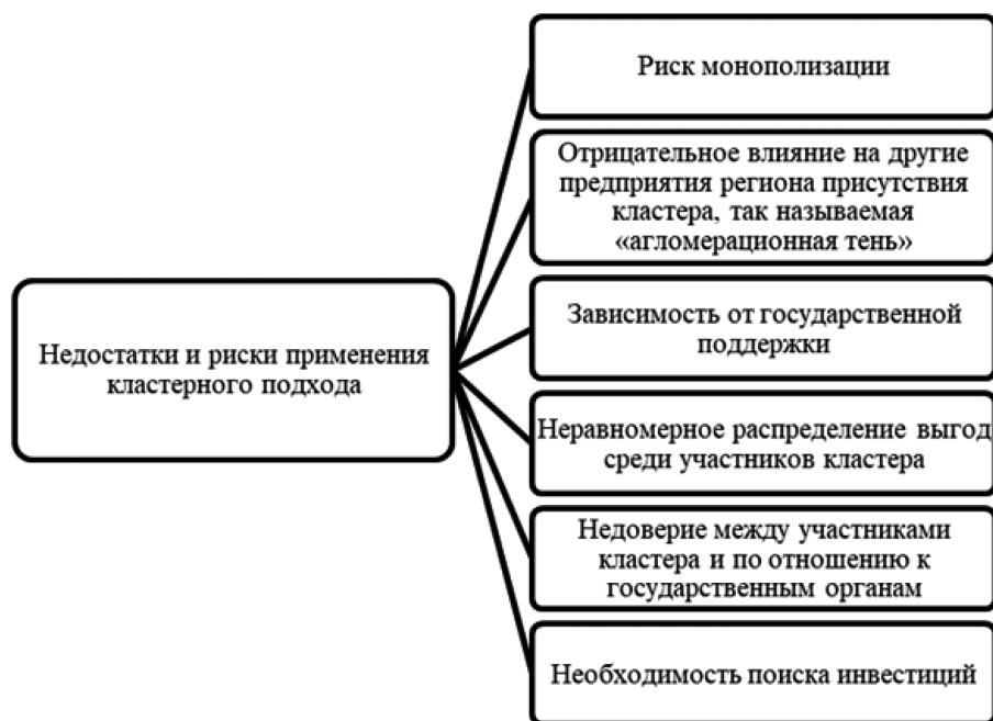
Рис. 2. Недостатки и риски применения кластерного подхода в российской промышленности