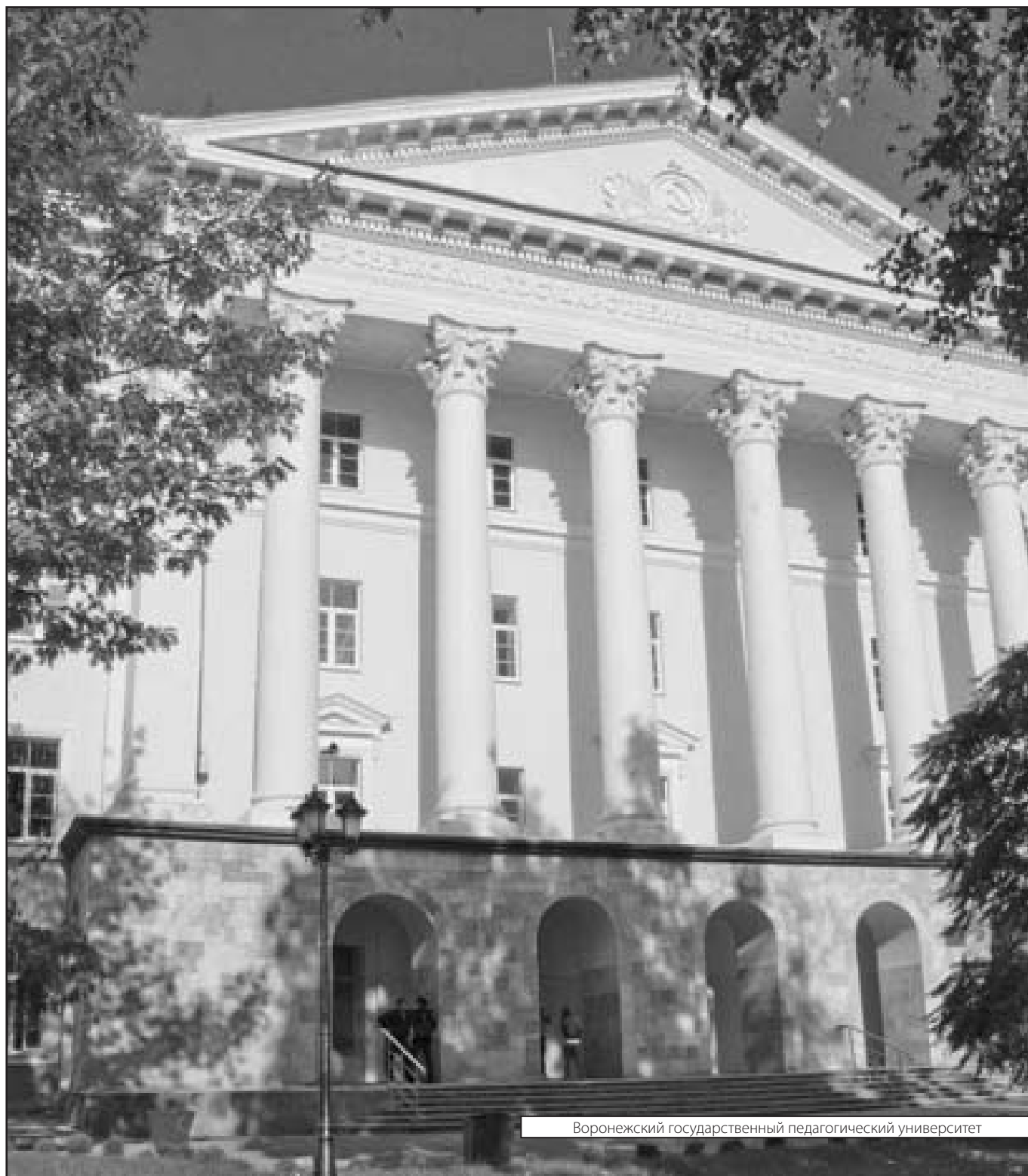
Воронежский государственный педагогический университет

Журнал «Современная наука: актуальные проблемы теории и практики»