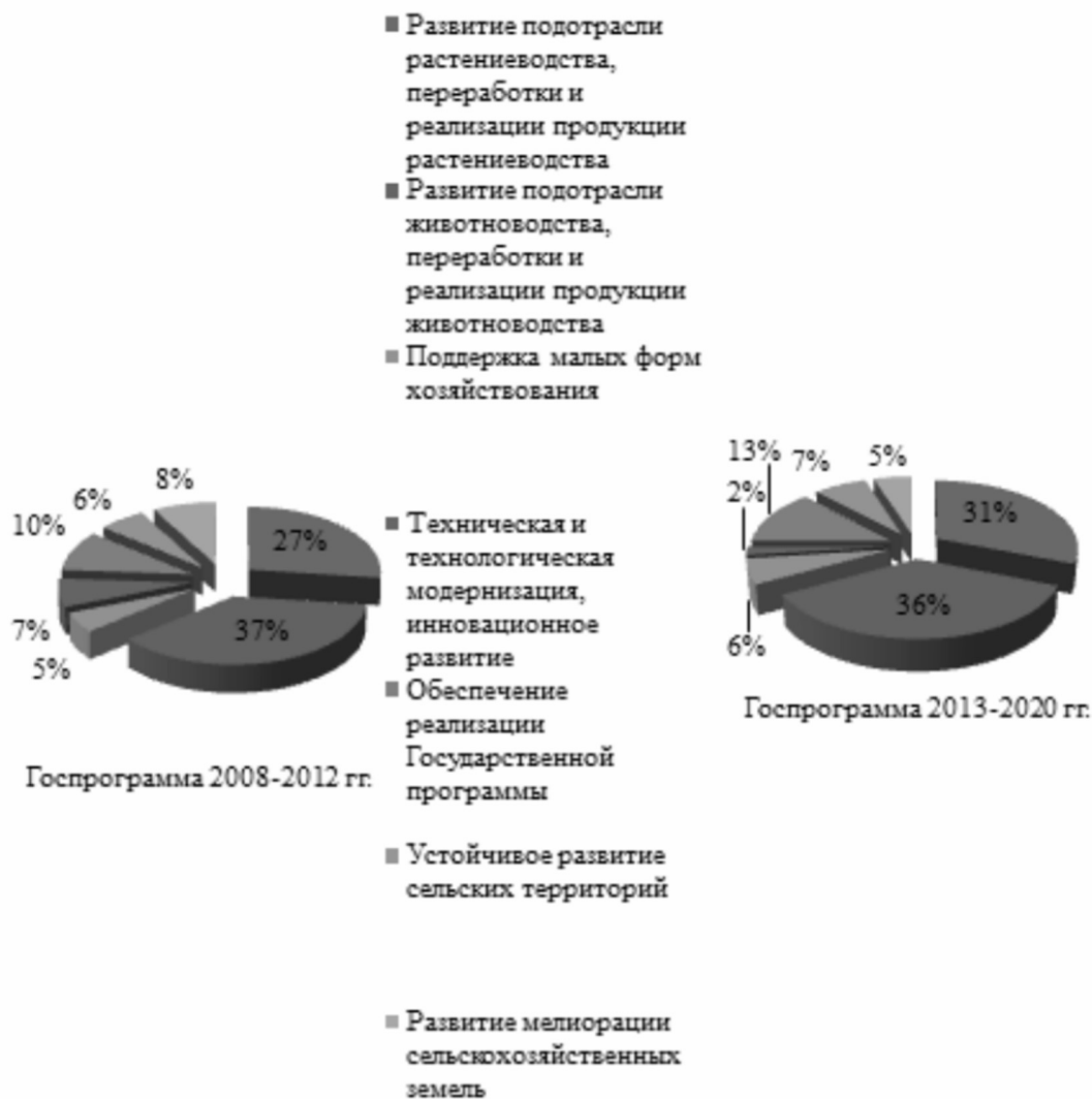
Рис. 2. Направления и объемы финансирования основных направлений Госпрограмм [5]

новой Госпрограммы среднегодовой темп роста продукции сельского хозяйства должен составить не менее 2,5%.