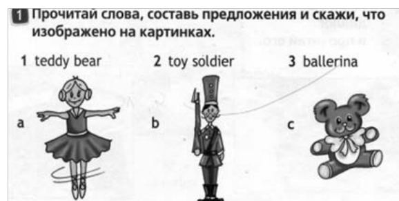
Рис. 9. Упражнение: составление предложений. [Virginia Evans]

Здесь подойдут упражнения на составление предложений из готовых слов или фраз. Например, можно предложить упражнение на описание какого-либо предмета предложениями из прочитанного текста.