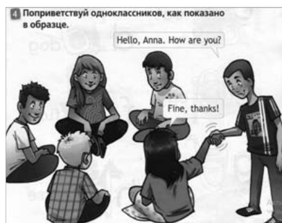
Рис. 1. Упражнение: знакомство. [Virginia Evans]