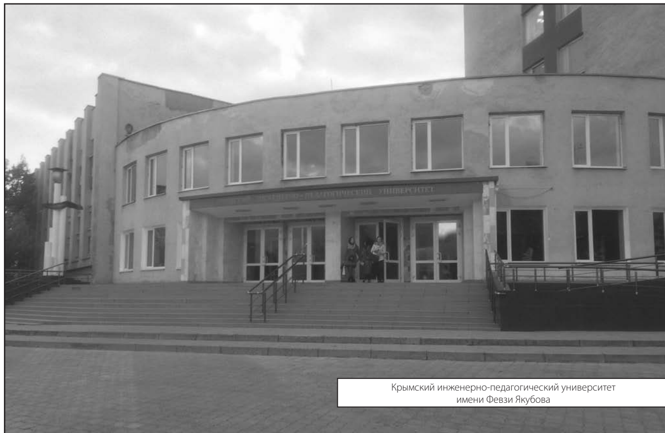
Крымский инженерно-педагогический университет имени Февзи Якубова

Журнал «Современная наука: актуальные проблемы теории и практики»