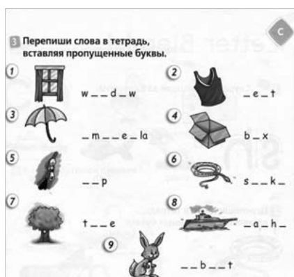
Рис. 2. Упражнение: словарная работа. [Virginia Evans]