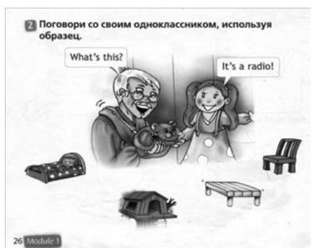
Рис. 10. Упражнение: диалог. [Virginia Evans]

начальных этапах предлагается составить рассказ из нескольких предложений с описанием себя или семьи. Также можно предложить составить небольшой диалог по образцу.