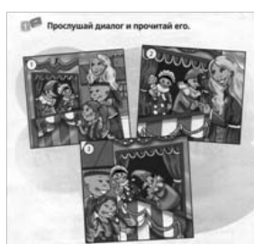
Рис. 7 Упражнения на различные виды восприятия. [Virginia Evans]

При обучении английскому языку необходимо развивать четыре основных вида речевой деятельности, которые выделяются в психолингвистике: аудирование (слушание), говорение, чтение и письмо [12]. К устной речи относят говорение и аудирование, к письменной — чтение и письмо. Ко вторичным видам речевой деятельности — перевод. Исходя из этого, необходимо подбирать упражнения на развитие каждого вида речевой деятельности. Это можно сделать не только путём выполнения упражнений из учебника, но и через игровую деятельность.