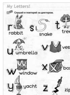
Рис. 8. Повторение слов. [Virginia Evans]

На данном этапе, обычно, проходит подготовка к чтению текста на английском языке или его прослушиванию. Учителю необходимо дать около десяти новых слов и предложить их записать в словарь, а затем, повторить вслух.