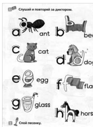
Рис. 5. Упражнения на аудиальное восприятие. [Virginia Evans]