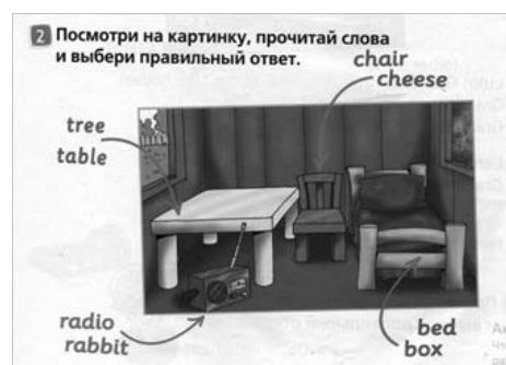
Рис. 4. Упражнение: правильный выбор. [Virginia Evans]

При рефлексивном когнитивном стиле рекомендуется давать задания, где нужно проанализировать и сопоставить несколько данных и выдать конечный ответ. Примером таких заданий является аудирование, при котором в тестовой форме ученику необходимо сопоставить несколько вариантов ответа исходя из прослушанного текста. Также будут уместны задания на сопоставление иностранных слов с их характеристикой или выбором правильного варианта среди предложенного перечня слов.