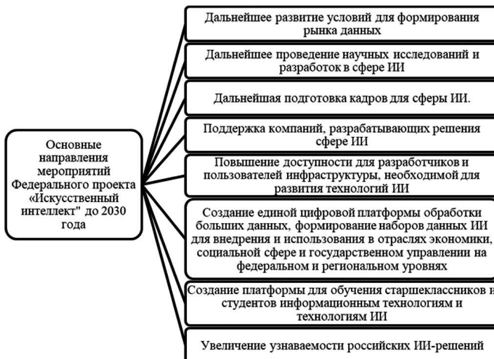
Рис. 2. Основные направления мероприятий Федерального проекта «Искусственный интеллект» до 2030 года