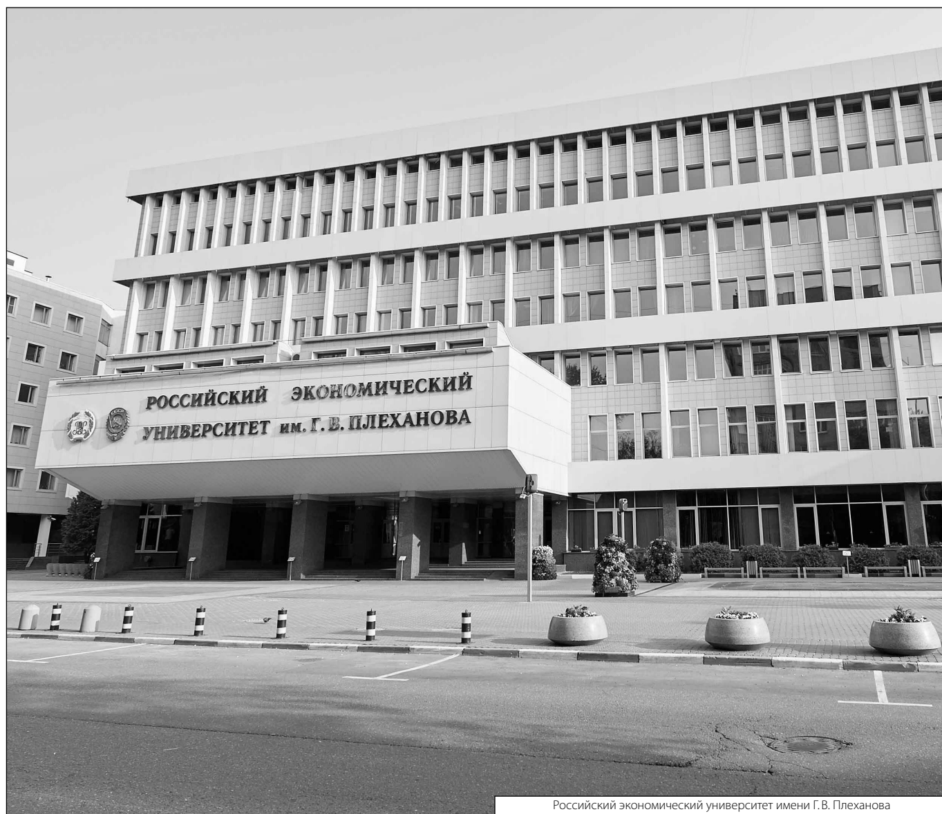
Российский экономический университет имени Г. В. Плеханова

Журнал «Современная наука: актуальные проблемы теории и практики»