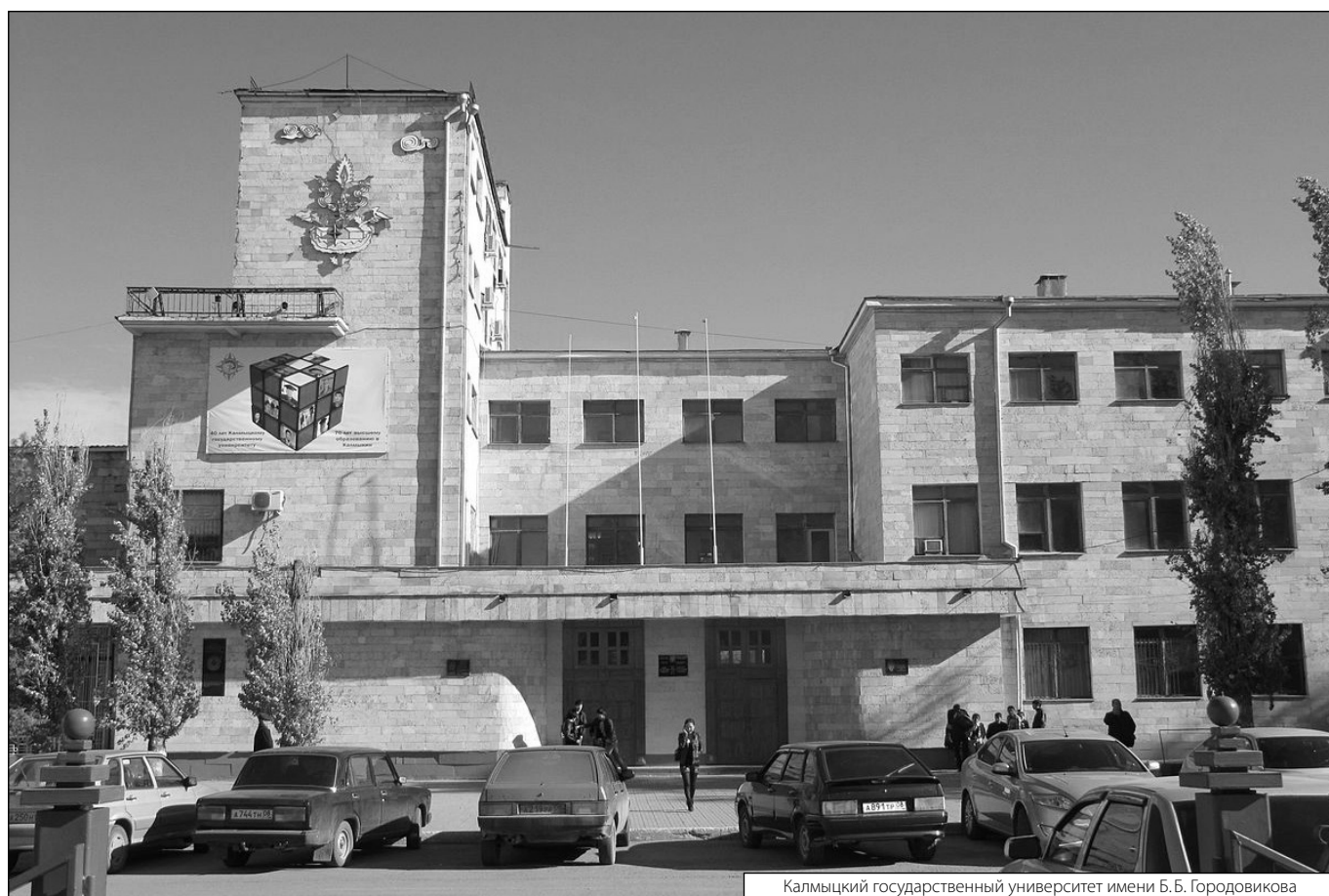
Калмыцкий государственный университет имени Б.Б. Городовикова

Журнал «Современная наука: актуальные проблемы теории и практики»