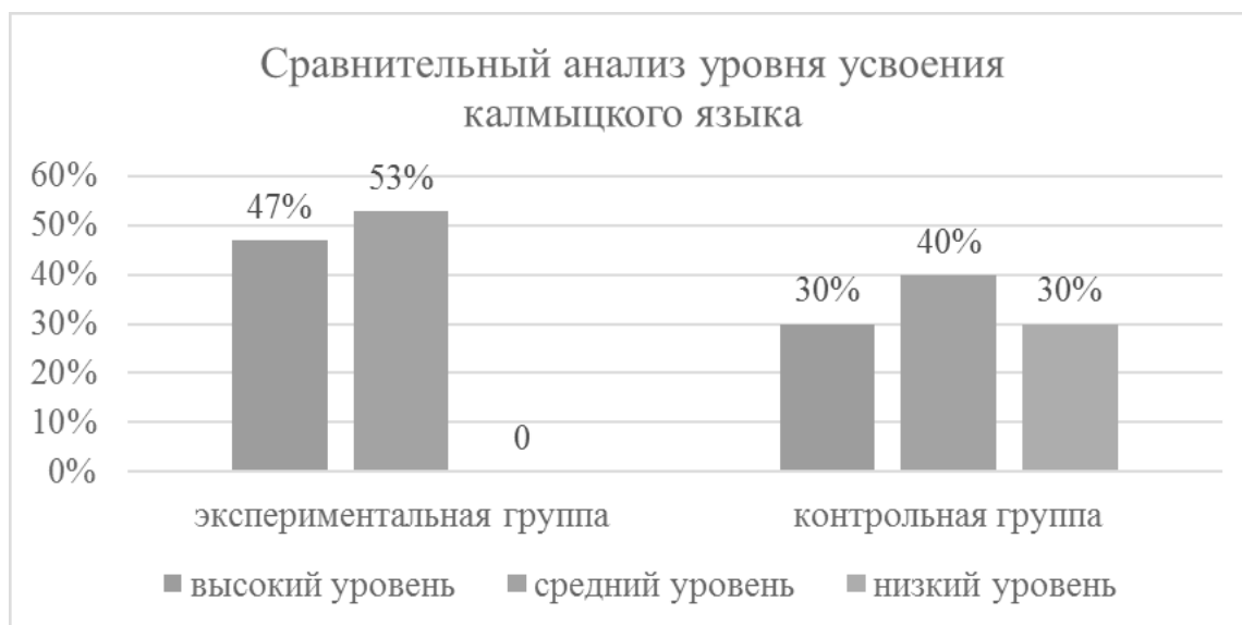
Рис. 2. Сравнительный анализ уровня усвоения калмыцкого языка

риментальной — на занятиях применялась разработанная нами рабочая тетрадь.