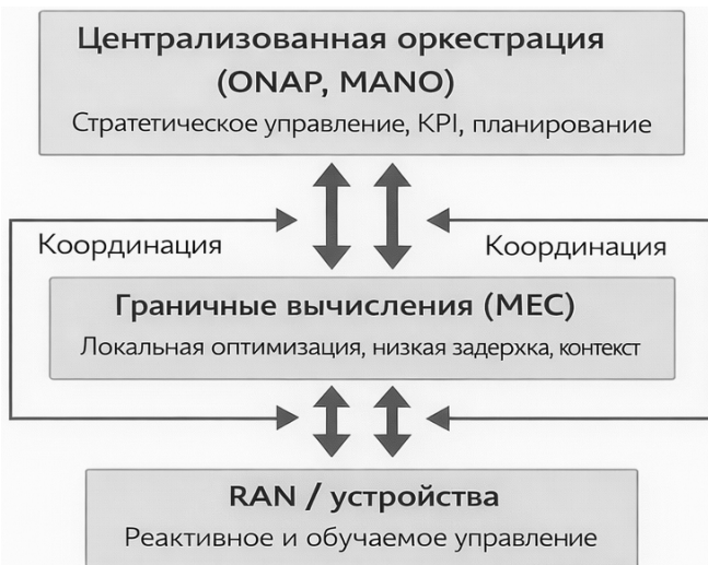
Рис. 3. Гибридная модель управления в сетях 5G/6G

Управление приобретает целеориентированный характер: оператор задаёт целевые показатели (KPI), а система автоматически адаптирует параметры сети. Гибридная модель распределённого управления в сетях 5G/6G, сочетающая централизованную оркестрацию и локальное принятие решений, представлена на рис. 3. Для этого используются методы машинного обучения, включая обучение с подкреплением, а также концепция автономных сетей (Autonomous Networks).