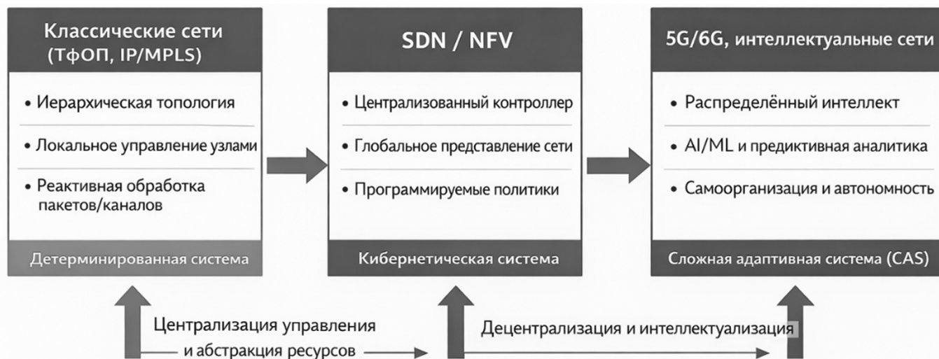
Рис. 1. Эволюция архитектур сетей связи как информационно-управляющих систем