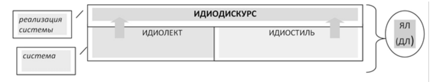
Схема 2. Взаимосвязь «Идиолект — идиостиль — идиодискурс»

Синтез когнитивного, эмотивного и мотивного пропускается через призму идиолекта, который, по сути, является единственно возможным инструментом вербализации индивидуальной языковой картины мира. Очевидно, что пишущий / говорящий может пользоваться только своей индивидуальной языковой системой, более или менее приближенной к среднестатистическому, типовому, стандартному варианту или удаленной от него.