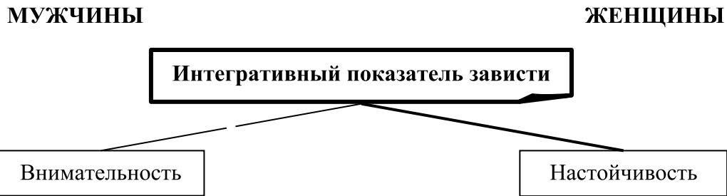
Рис. 1. Корреляции интегративного показателя зависти с волевыми характеристиками (гендерный аспект). Примечание: Пунктирная линия свидетельствует об обратной связи, а толщина линии — о значимости связи.