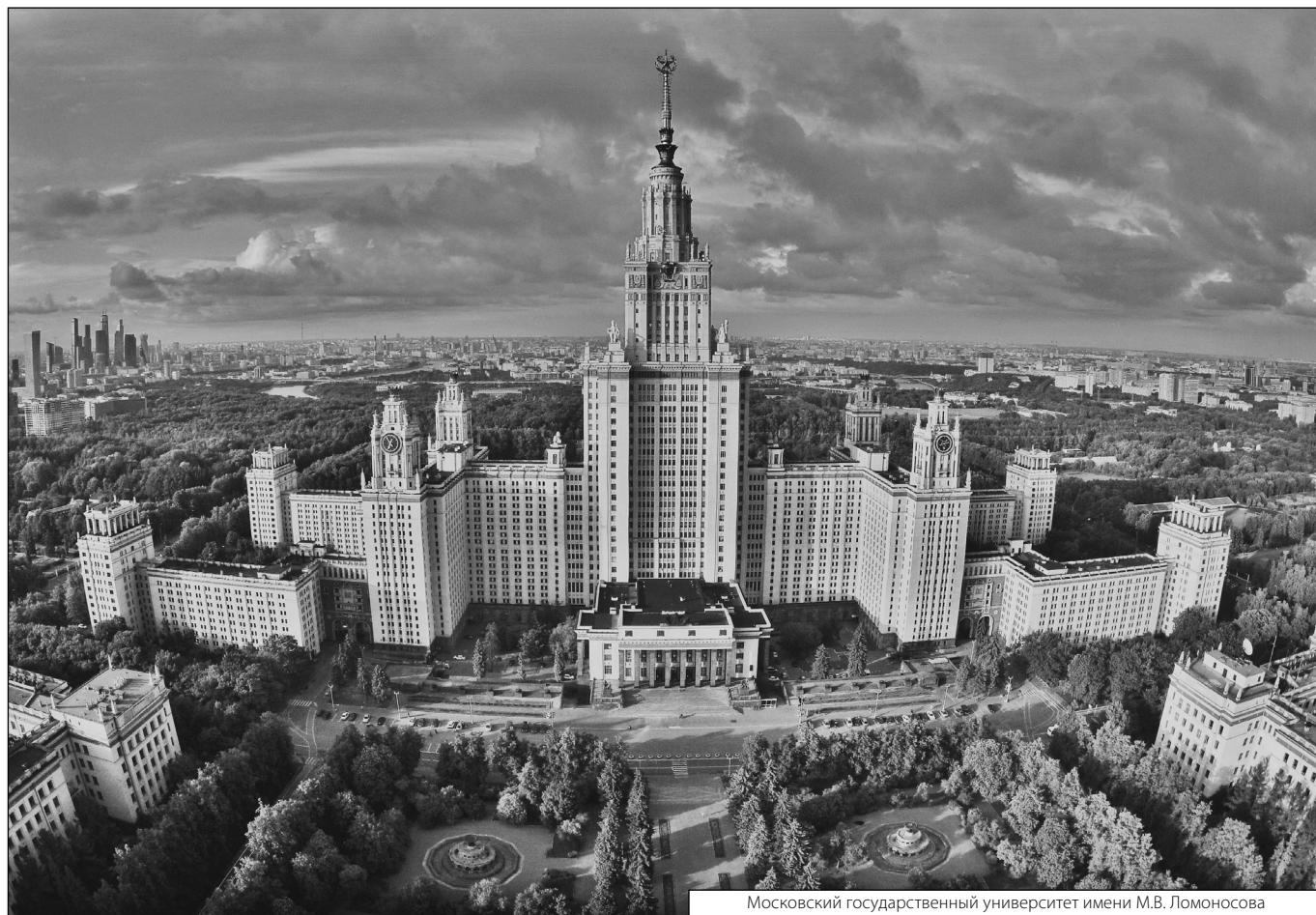
Московский государственный университет имени М.В. Ломоносова

Журнал «Современная наука: актуальные проблемы теории и практики»