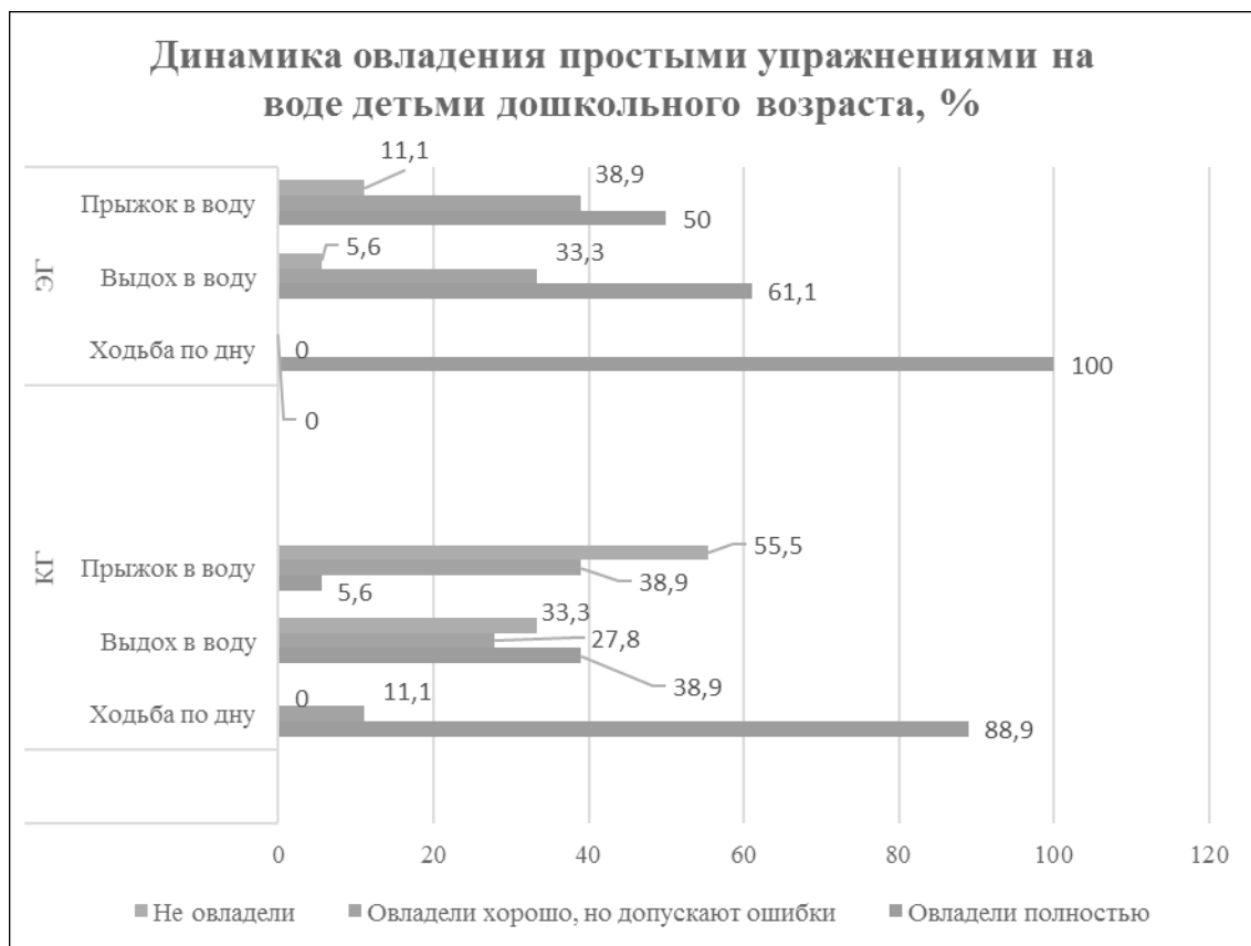
Рис. 1. Показатели овладения навыками в простых упражнениях на воде, %

ское воображение нарисует массу «картин», которые обуславливают причину повторения этой игры, пока детское воображение не закончит или не трансформирует данный сюжет.