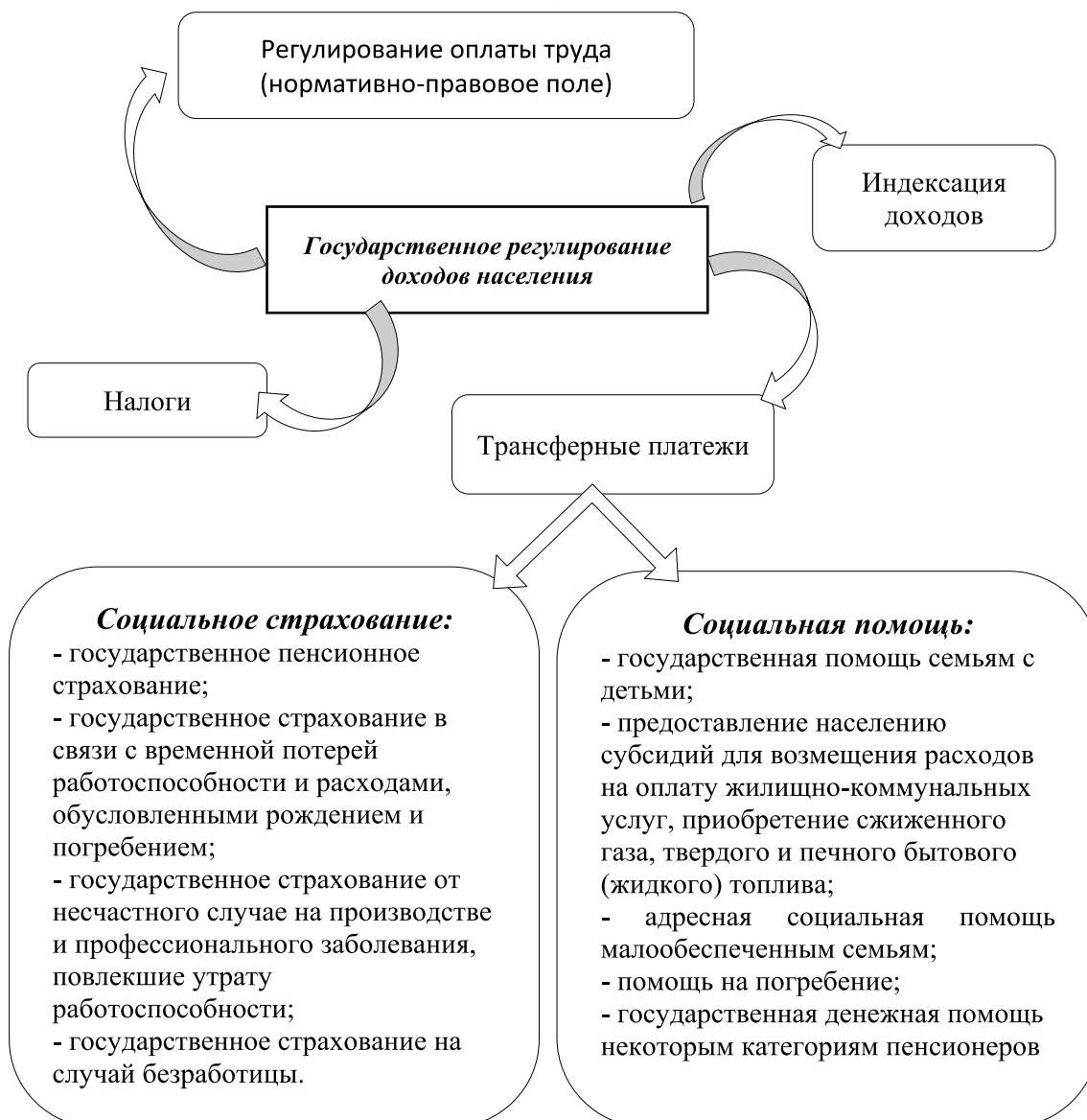
Рис. 4. Инструментарий государственного регулирования доходов населения

Многие фундаментальные проблемы современного общества не могут быть решены исключительно рыночными механизмами и нуждаются в государственном участии. Регулируя распределение национального дохода между различными факторами производства, государственные институты чаще всего используют инструменты, которые влияют на уровень оплаты труда, а также налогообложение (рис. 4).