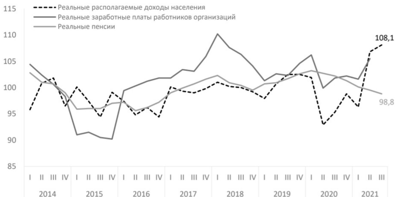
Рис. 2. Квартальная динамика реальных располагаемых доходов населения, заработных плат работников организаций и пенсий в 2014–2021 годах, в% к соответствующему периоду предшествующего года Источник: [11]