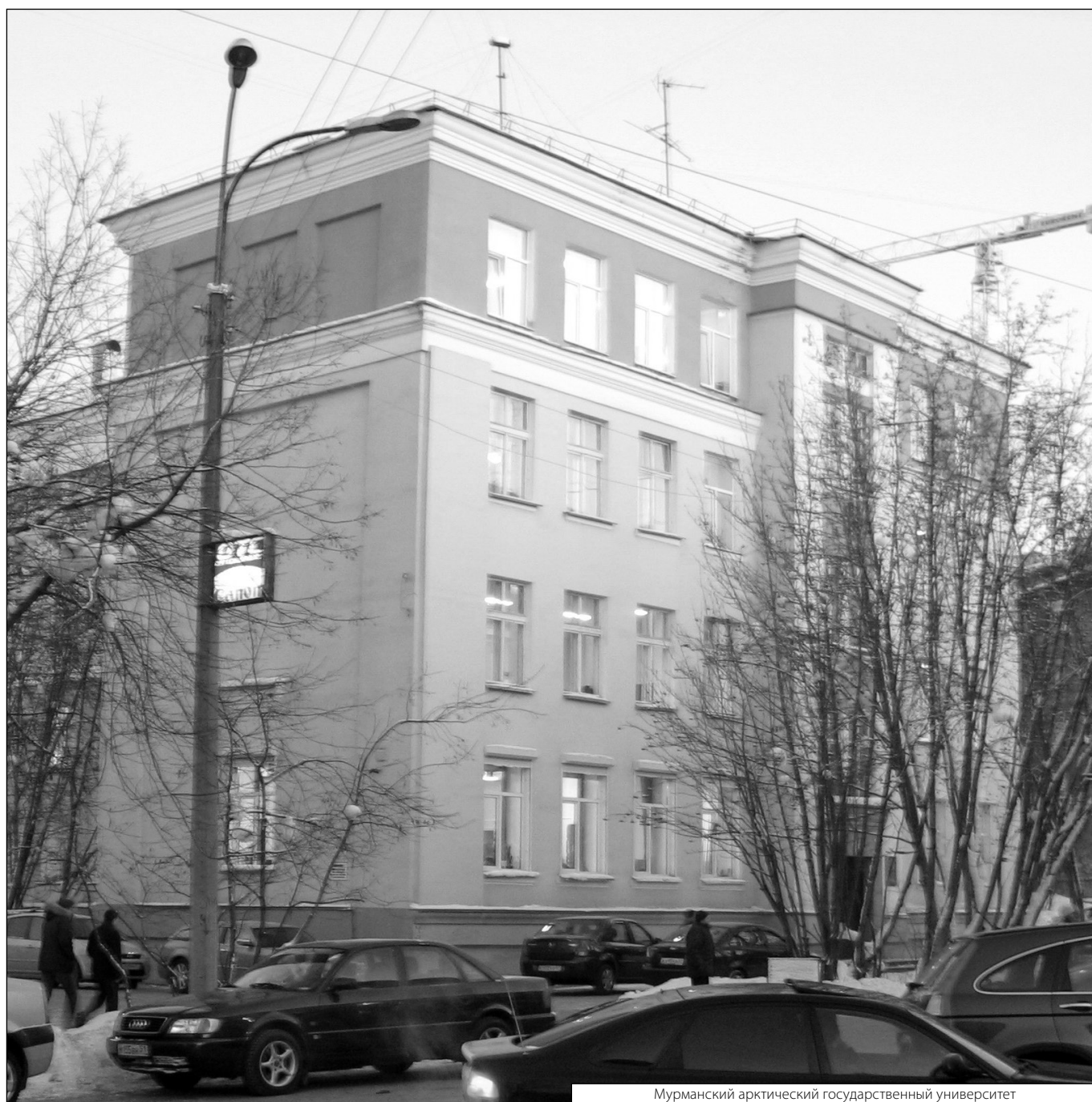
Мурманский арктический государственный университет

Журнал «Современная наука: актуальные проблемы теории и практики»