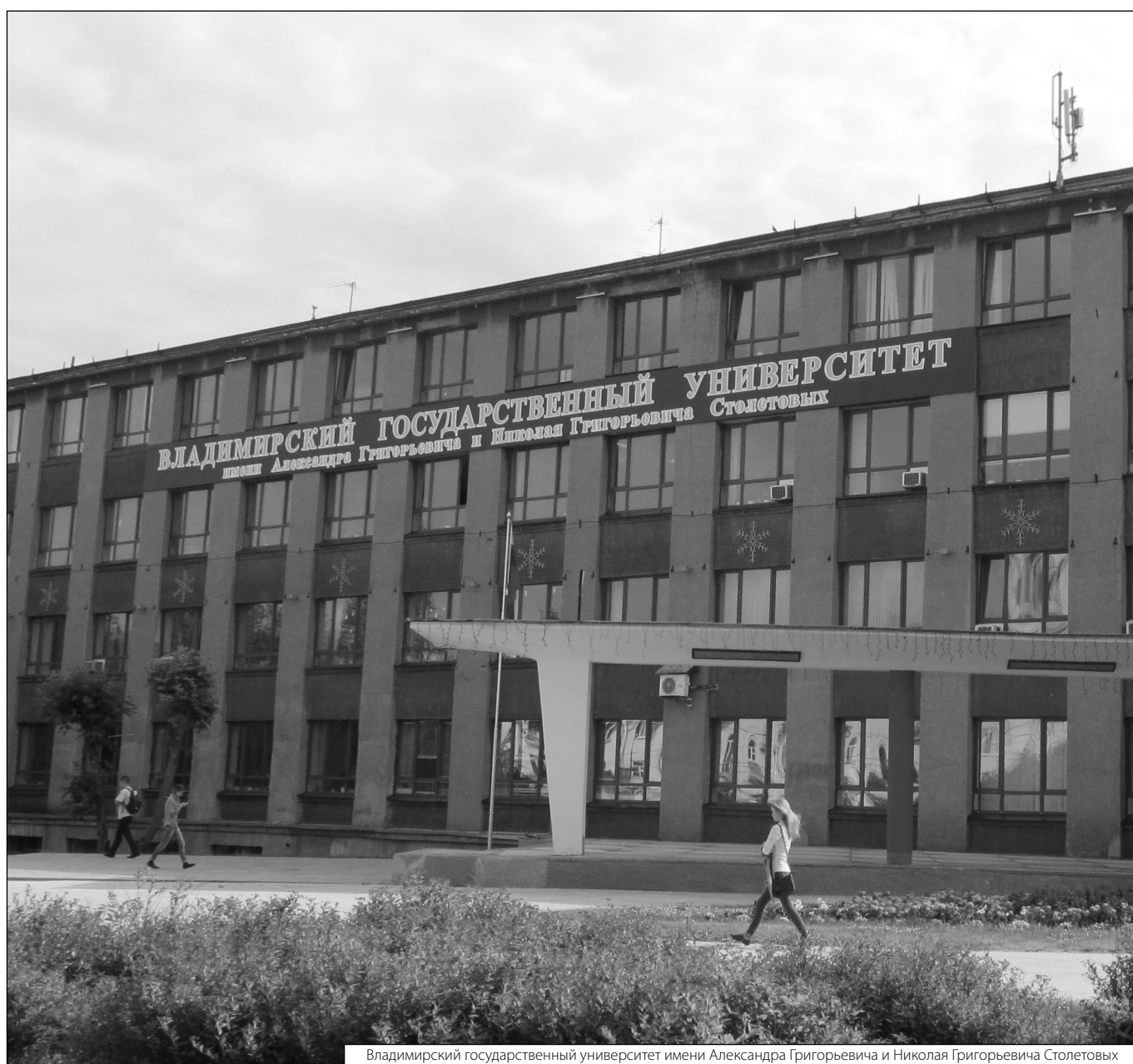
Владимирский государственный университет имени Александра Григорьевича и Николая Григорьевича Столетовых

Журнал «Современная наука: актуальные проблемы теории и практики»