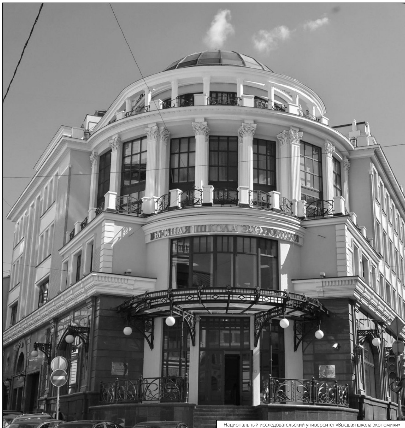
Национальный исследовательский университет «Высшая школа экономики»

Журнал «Современная наука: актуальные проблемы теории и практики»