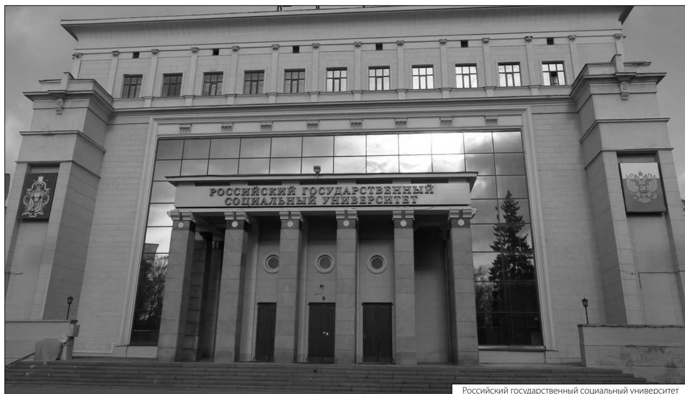
Российский государственный социальный университет

Журнал «Современная наука: актуальные проблемы теории и практики»