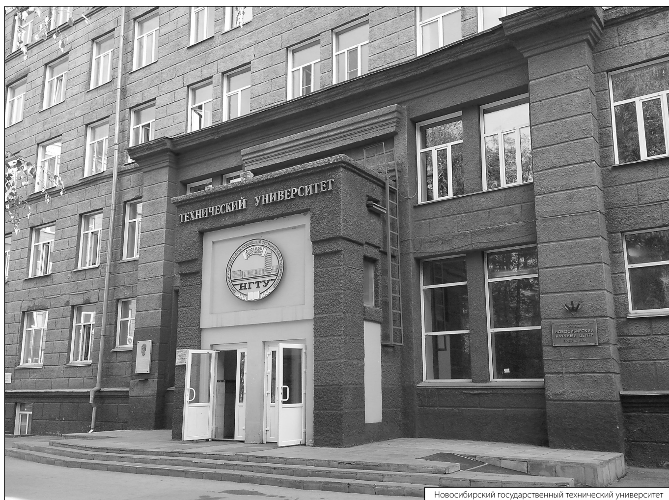
Новосибирский государственный технический университет

Журнал «Современная наука: актуальные проблемы теории и практики»