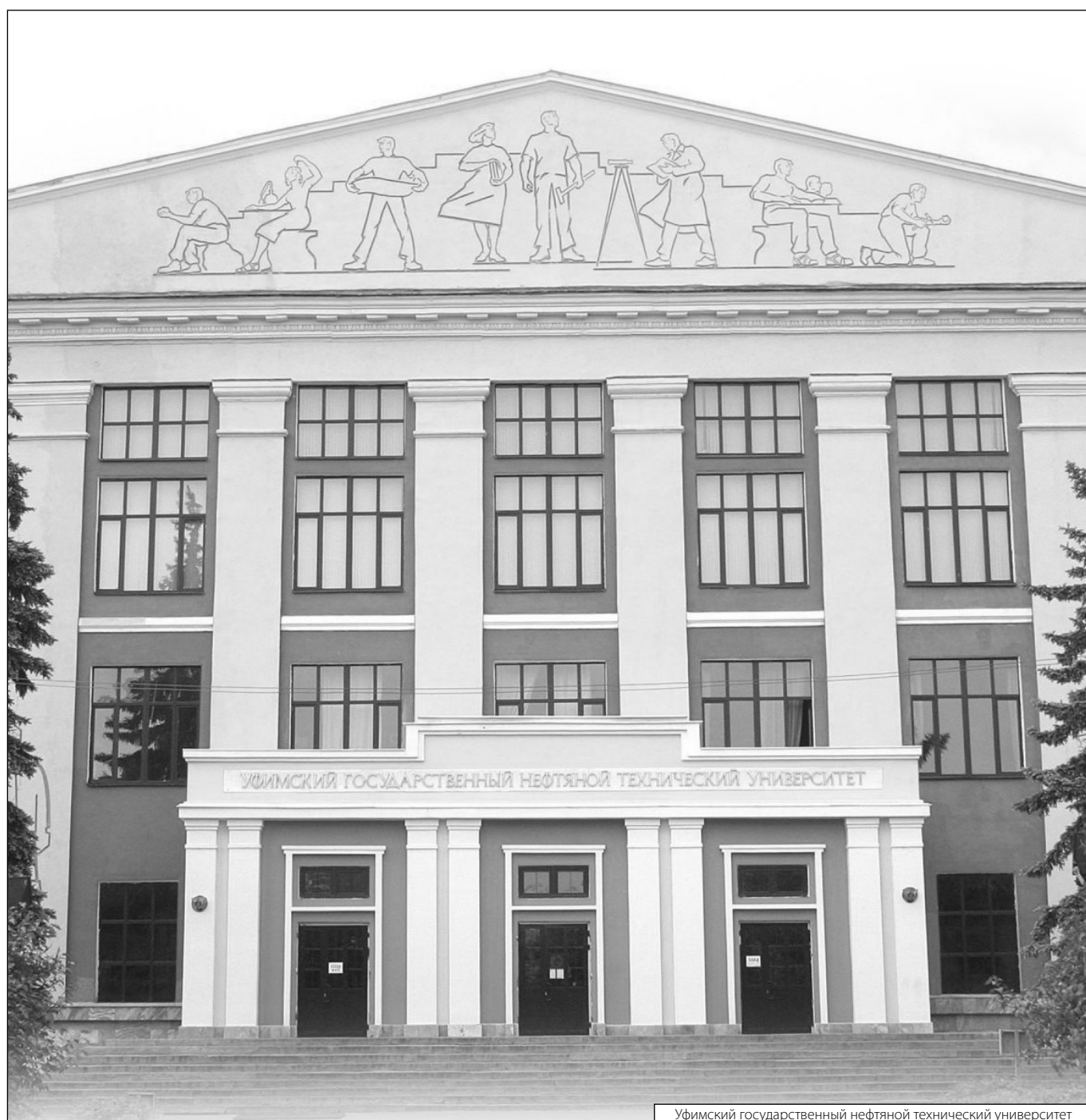
Уфимский государственный нефтяной технический университет