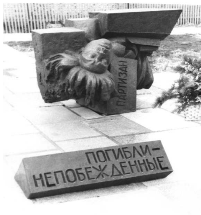
Рис. 6. Памятник «Скорбь матери-Родины» в ст. Романовской

комсомольцев, вчерашних школьников, учителей начальных классов, не имевших ни военного образования, ни боевого опыта, ни даже полноценного оружия, держала в страхе регулярные части вермахта. 12 крупных диверсий. 40 уничтоженных солдат и офицеров. 5 ликвидированных полицаев. Взорванный склад горючего. Разрушенная переправа. Три сотни листовок, переписанных от руки и распространённых по станице. Семеро спасённых красноармейцев, и всё это – руками подпольщиков.