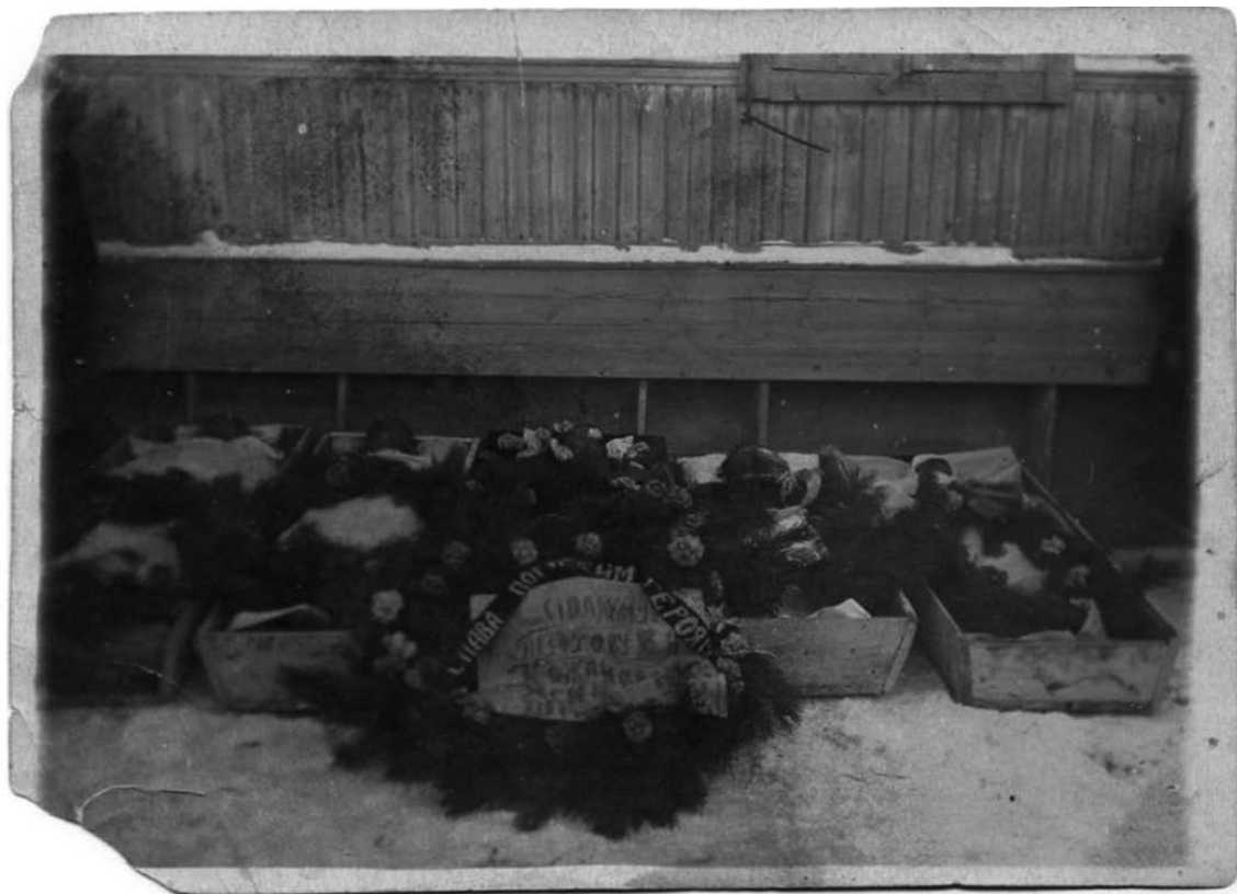
Рис. 5. Тела казнённых романовских подпольщиков. Январь 1943 г.

Был составлен акт осмотра с записью: «При осмотре