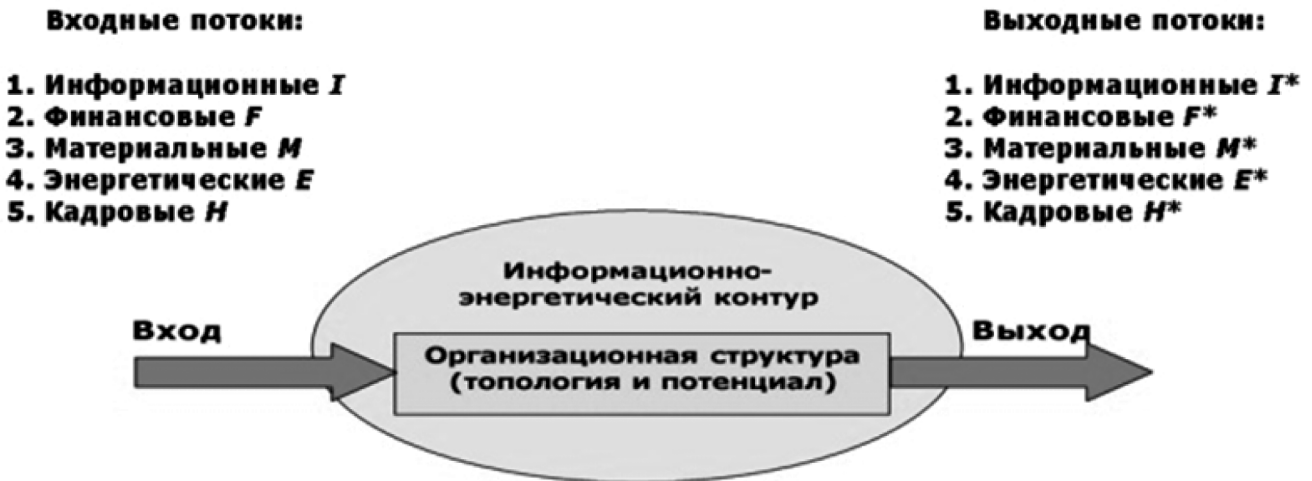
Рис. 1. Динамические контурные потоки [5, с. 39]

«Текстовая классификация позволяет сократить время на обработку электронных документов, но также не стоит забывать об особенностях языка, на котором составлены документы» [2, с. 44]. К особенностям языка можно отнести в том числе синонимичные значения конструкций, или обратную ситуацию — похожесть текстовых конструкций при первом обращении, но сильно отличающиеся по смысловому содержанию.