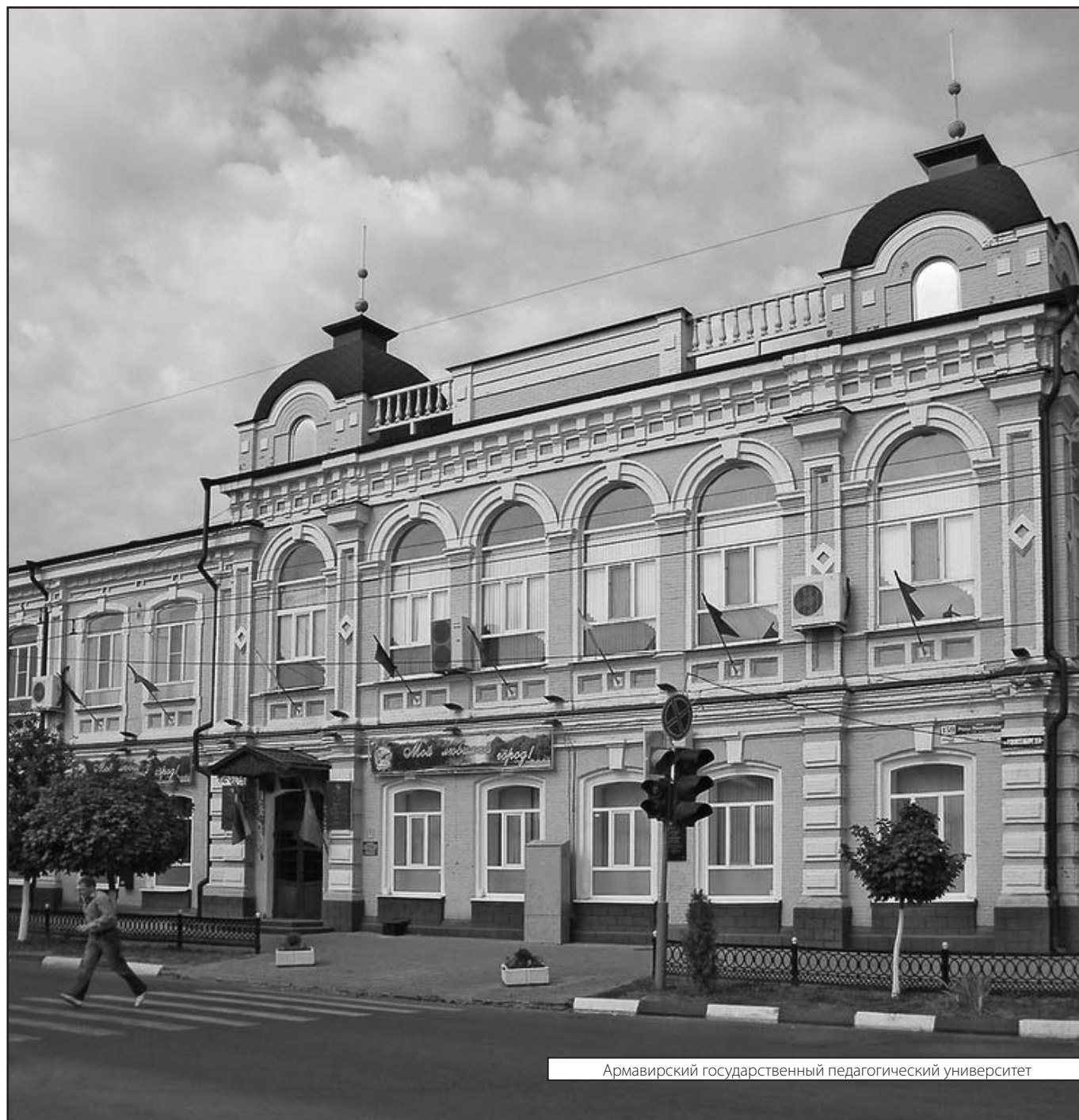
Армавирский государственный педагогический университет

Журнал «Современная наука: актуальные проблемы теории и практики»