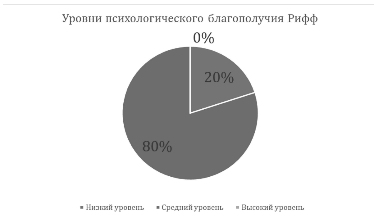
Рис. 1. Результаты по Шкале психологического благополучия Рифф

В сфере управления окружением респондент демонстрирует умеренные компетенции. Он умеет контролировать отдельные аспекты внешней деятельности, эффективно использовать предоставляющиеся возможности. В определенной степени он способен создавать условия, благоприятные для удовлетворения своих потребностей и достижения целей. Более того, респондент