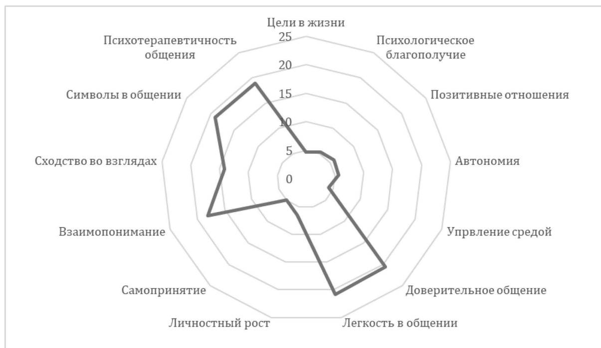
Рис. 3. Социально-психологический портрет представлений молодежи о супружеских отношениях

На первый вопрос: «Как вы понимаете супружеские отношения, отметьте от 2х до 10-ти факторов, влияющих на супружеские отношения, добавьте свои»: