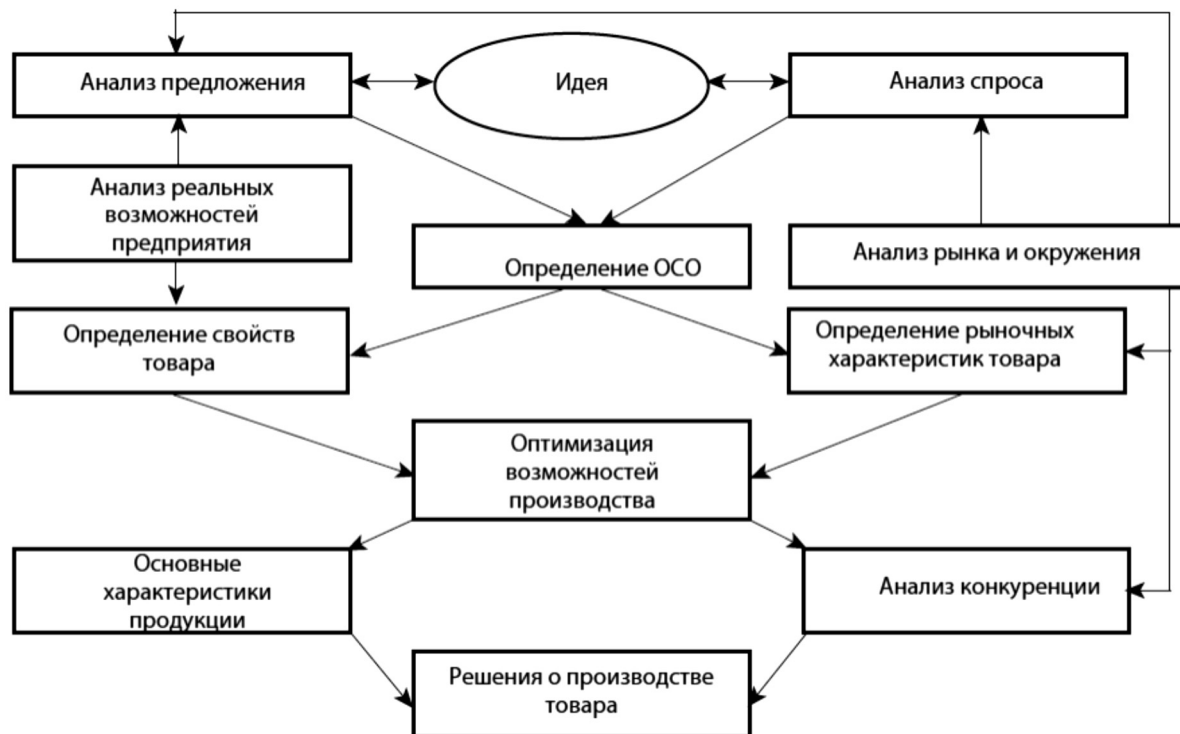
Рисунок 2. Этапы процесса принятия решения о производстве товара.

В условиях жесткой конкуренции предприятию необходимо больше уделять внимания формированию оптимальной стратегии, которая является базой для планирования перспективных исследований, кадровой и инвестиционной политики.