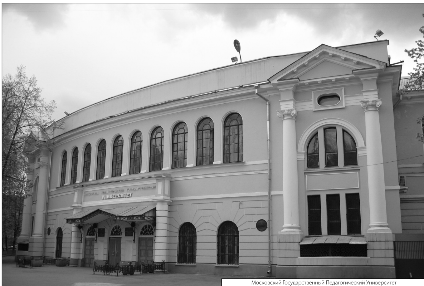
Московский Государственный Педагогический Университет

Журнал «Современная наука: актуальные проблемы теории и практики»