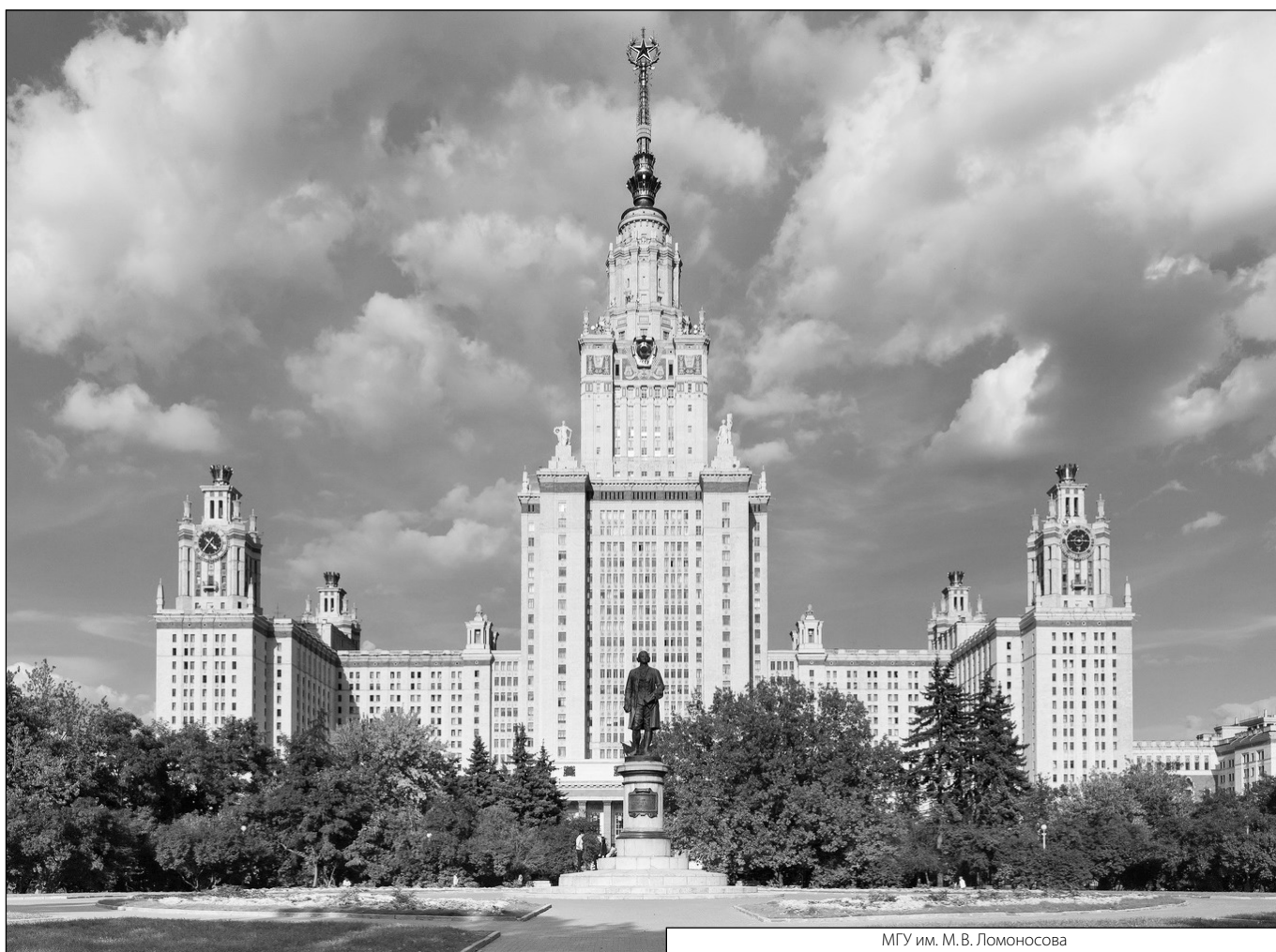
МГУ им. М.В. Ломоносова

Журнал «Современная наука: актуальные проблемы теории и практики»