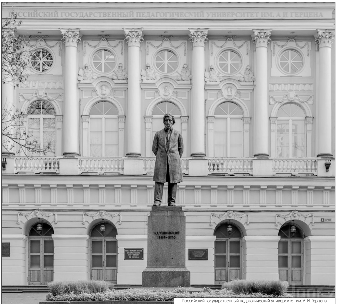
Российский государственный педагогический университет им. А. И. Герцена

Журнал «Современная наука: актуальные проблемы теории и практики»