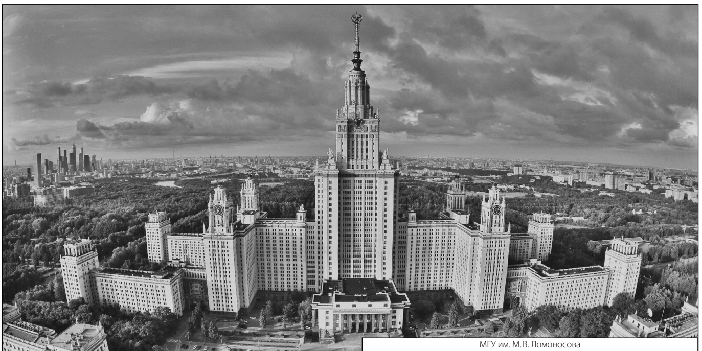
МГУ им. М.В. Ломоносова

Журнал «Современная наука: актуальные проблемы теории и практики»