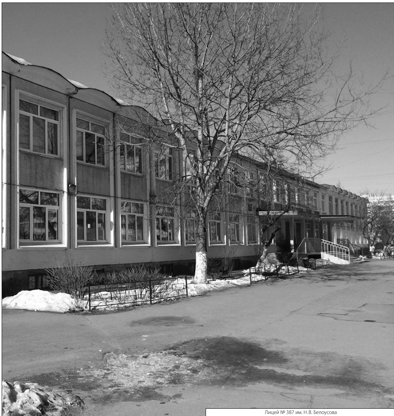
Лицей № 387 им. Н.В. Белоусова

Журнал «Современная наука: актуальные проблемы теории и практики»