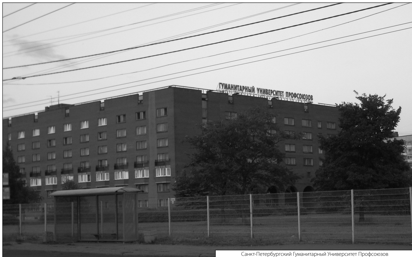
Санкт-Петербургский Гуманитарный Университет Профсоюзов

© Гезенко Дарья Павловна ( billy_92@mail.ru ), Гезенко Дарья Павловна ( billy_92@mail.ru ). Журнал «Современная наука: актуальные проблемы теории и практики»