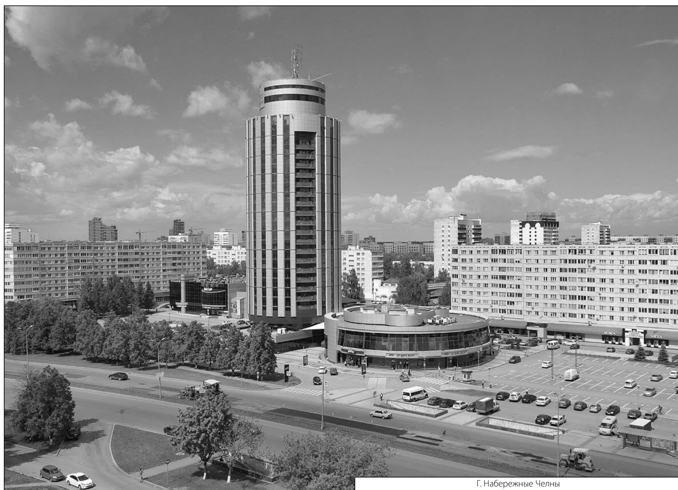
Г. Набережные Челны

Журнал «Современная наука: актуальные проблемы теории и практики»