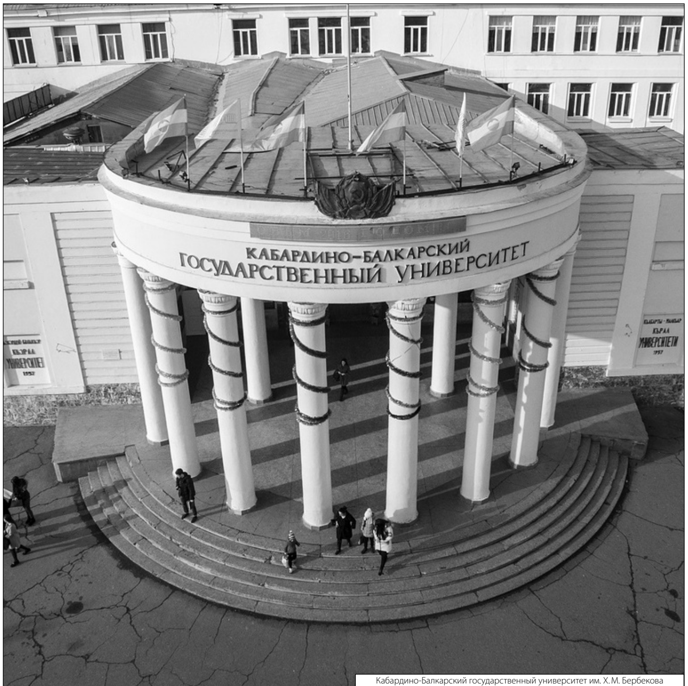
Кабардино-Балкарский государственный университет им. Х. М. Бербекова

© Ногерова Марьям Татуевна ( noger.mar@mail.ru ), Малкарова Рахима Хизировна ( mtd61@mail.ru ), Созаев Азамат Борисович ( azamat-s@list.ru ), Похомова Оксана Юрьевна ( ms.ksuy@bk.ru ). Журнал «Современная наука: актуальные проблемы теории и практики»