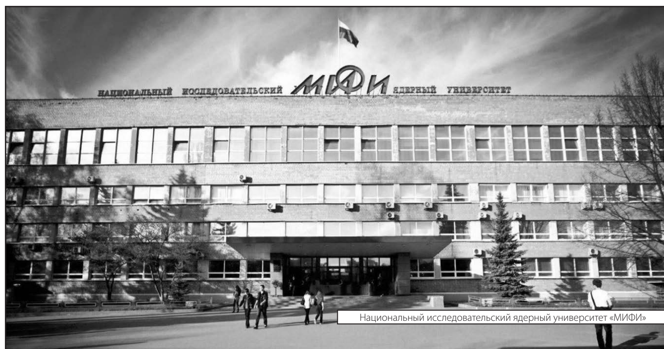
Национальный исследовательский ядерный университет «МИФИ»

Журнал «Современная наука: актуальные проблемы теории и практики»