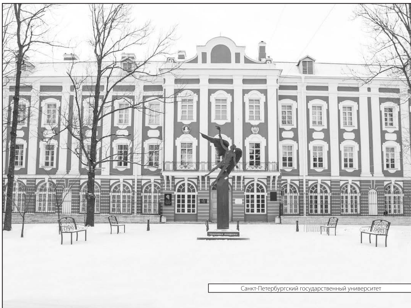
Санкт-Петербургский государственный университет

Журнал «Современная наука: актуальные проблемы теории и практики»