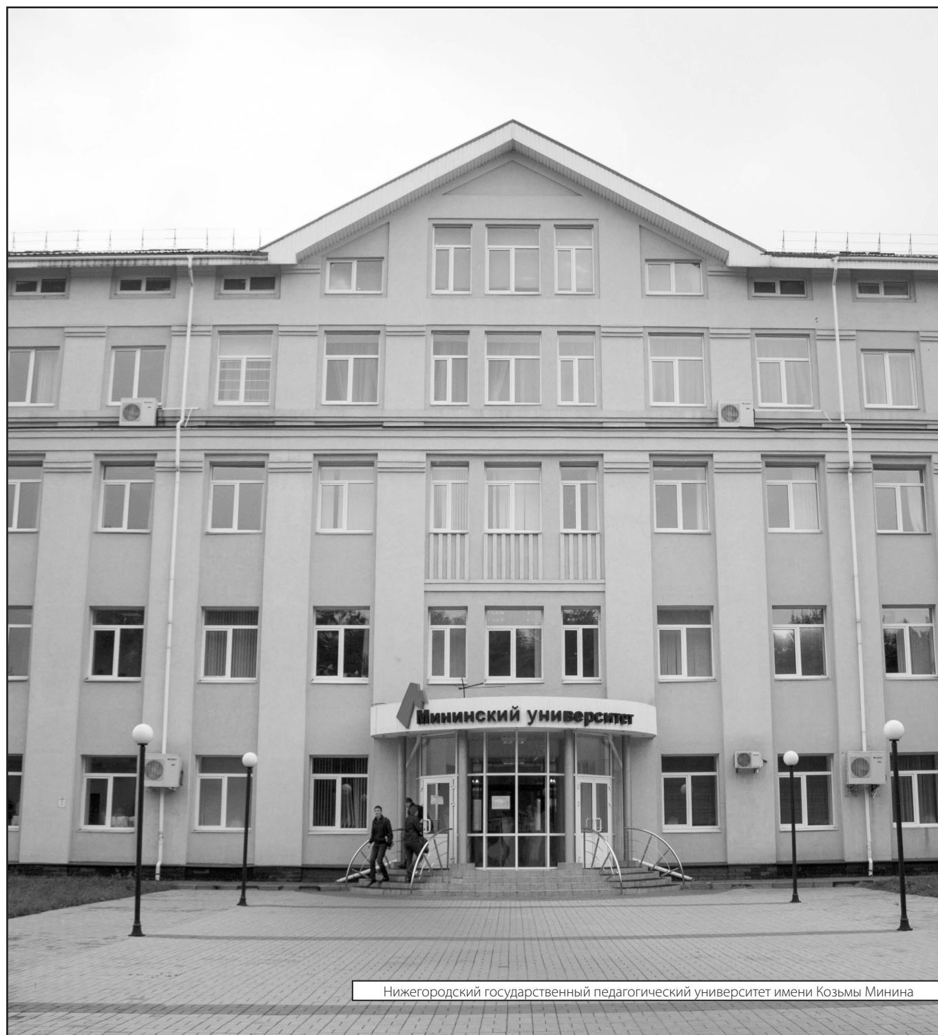
Нижегородский государственный педагогический университет имени Козьмы Минина

Журнал «Современная наука: актуальные проблемы теории и практики»