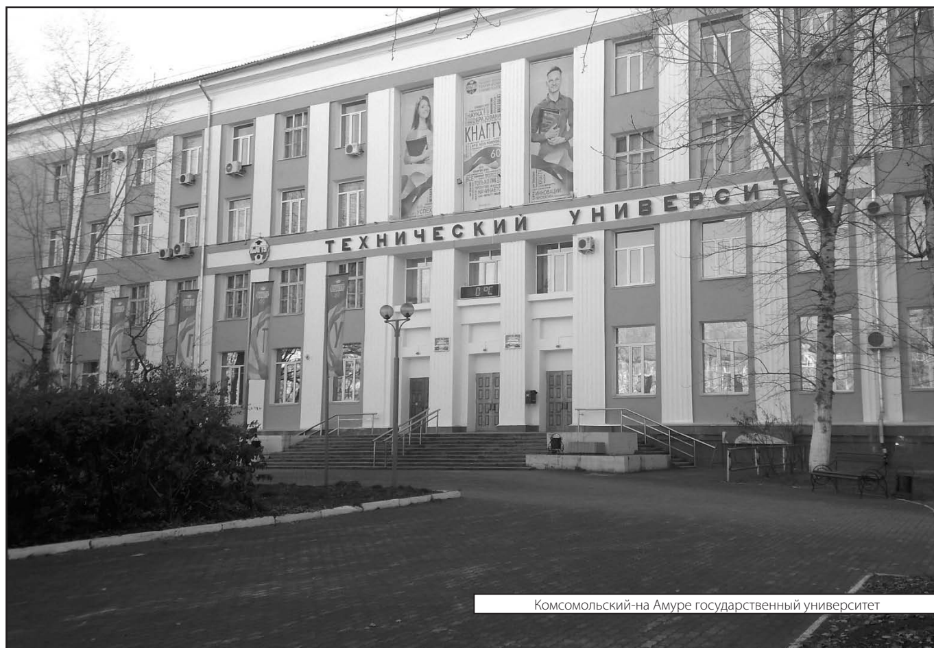
Комсомольский-на Амуре государственный университет

Журнал «Современная наука: актуальные проблемы теории и практики»