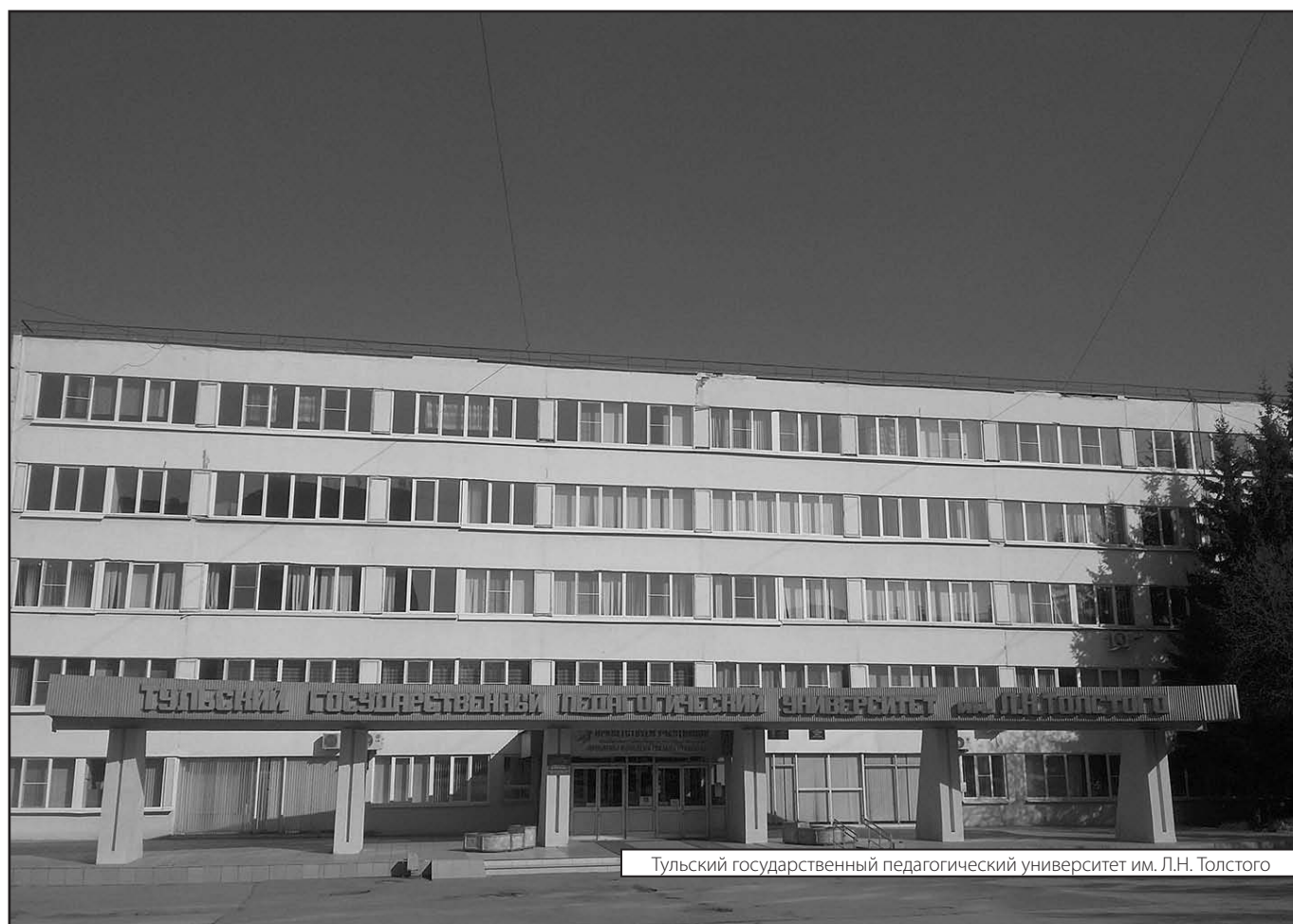
Тульский государственный педагогический университет им. Л.Н. Толстого

Журнал «Современная наука: актуальные проблемы теории и практики»