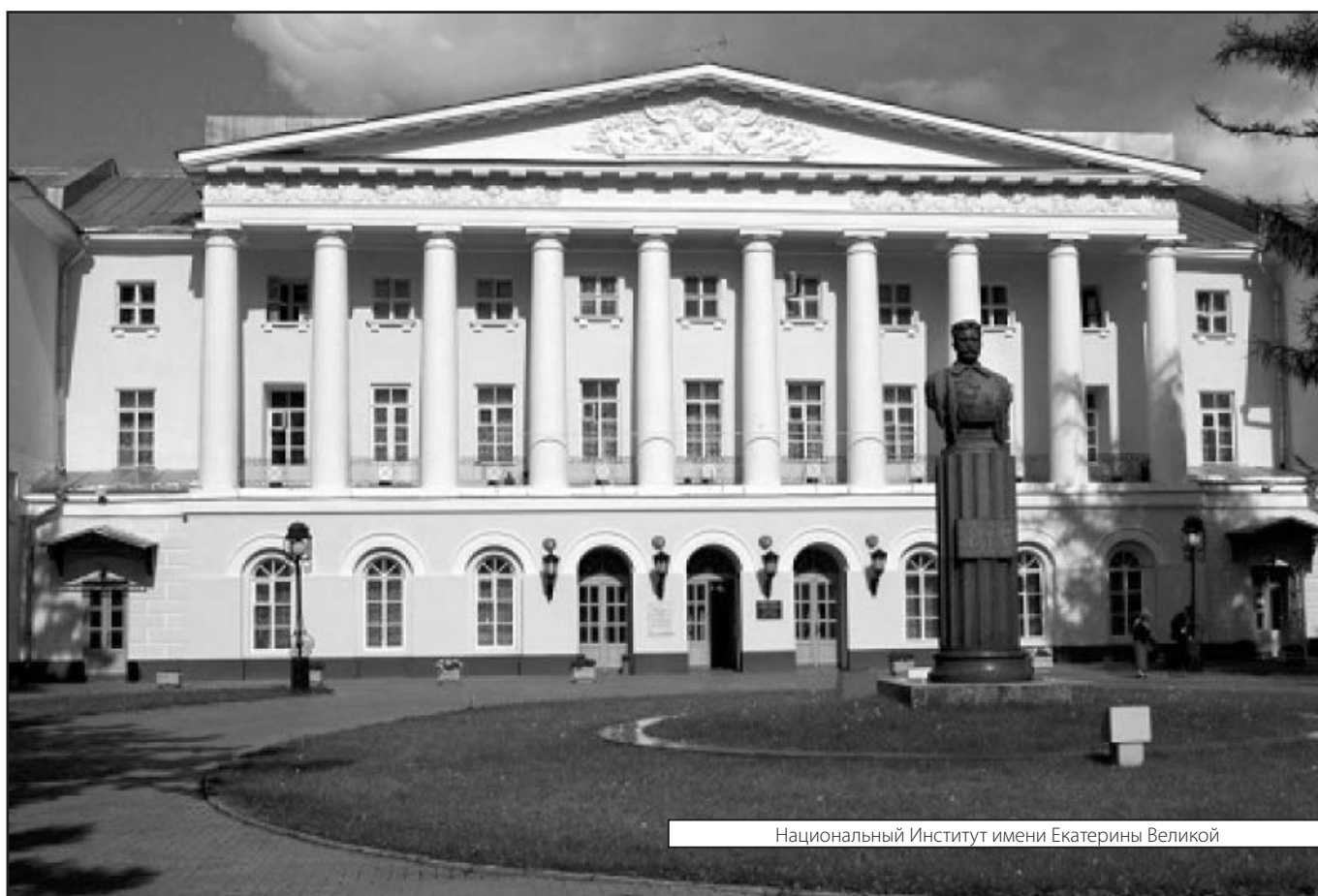
Национальный Институт имени Екатерины Великой

Журнал «Современная наука: актуальные проблемы теории и практики»