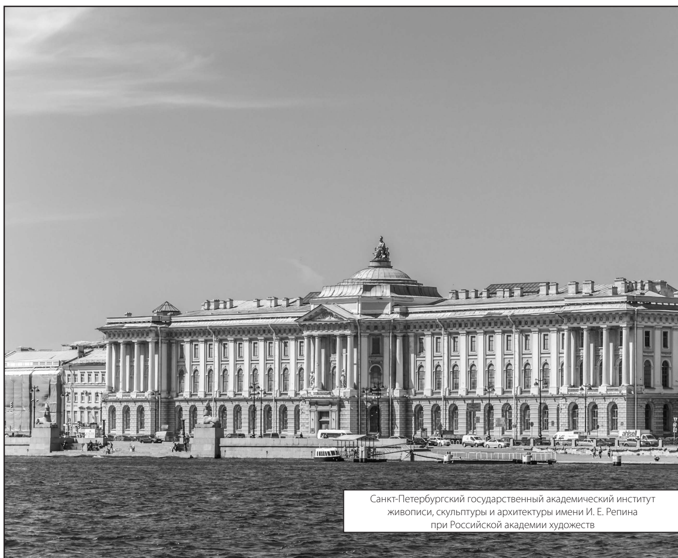
Санкт-Петербургский государственный академический институт живописи, скульптуры и архитектуры имени И. Е. Репина при Российской академии художеств

Журнал «Современная наука: актуальные проблемы теории и практики»