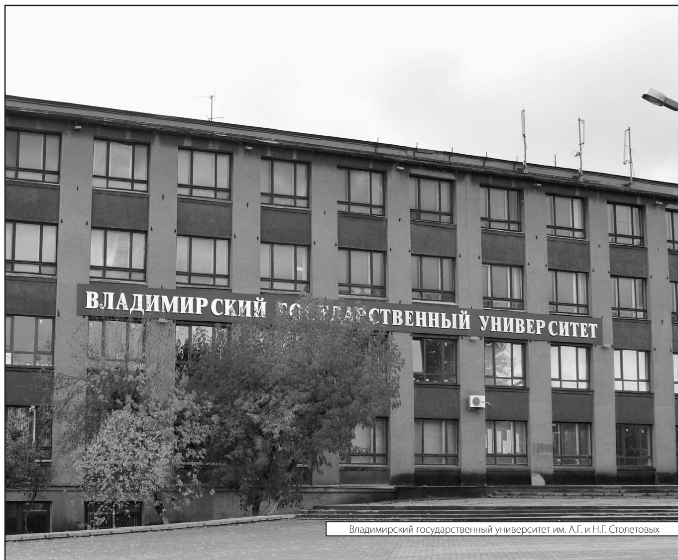
Владимирский государственный университет им. А.Г. и Н.Г. Столетовых

Журнал «Современная наука: актуальные проблемы теории и практики»