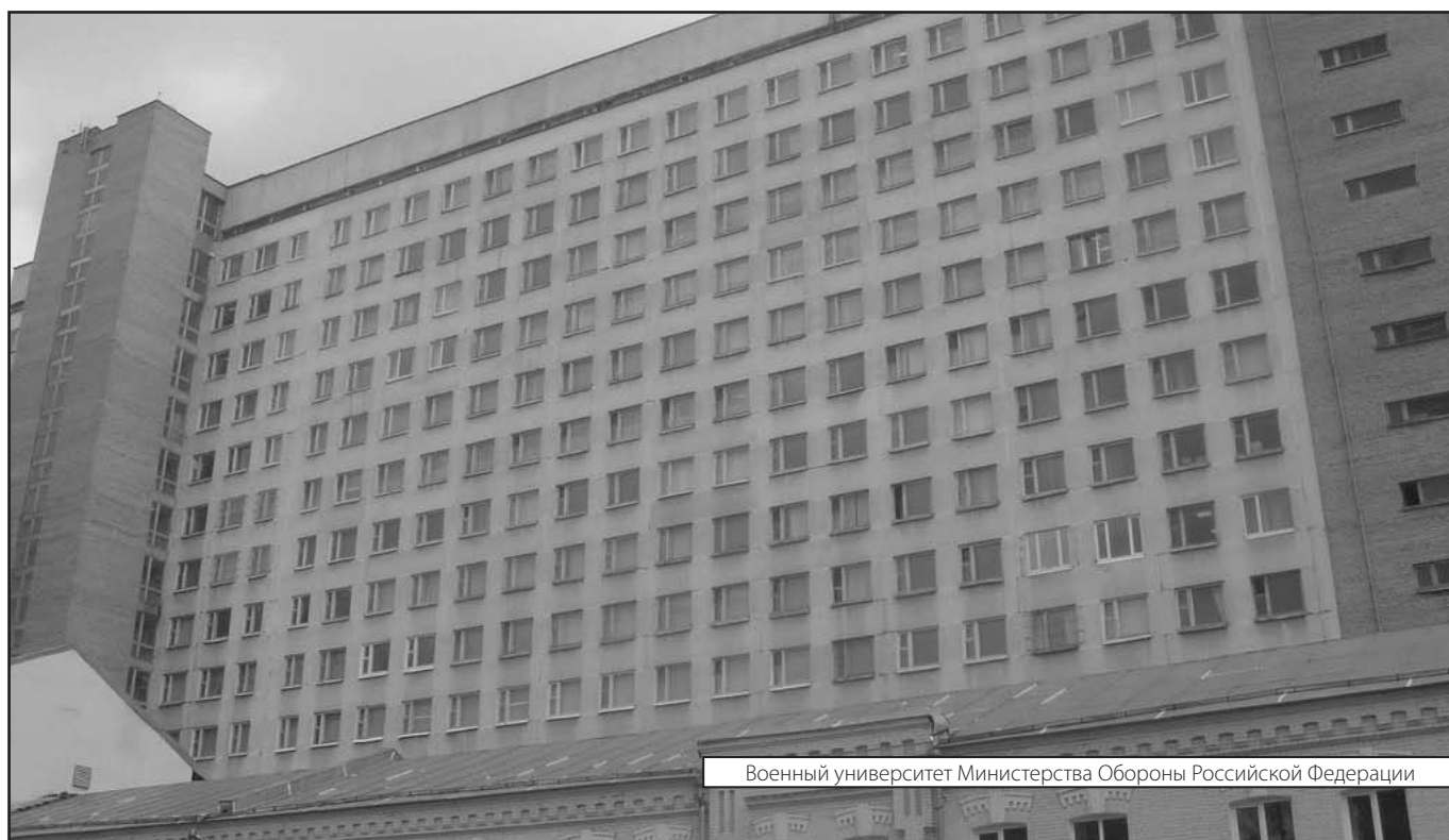
Военный университет Министерства Обороны Российской Федерации

Журнал «Современная наука: актуальные проблемы теории и практики»