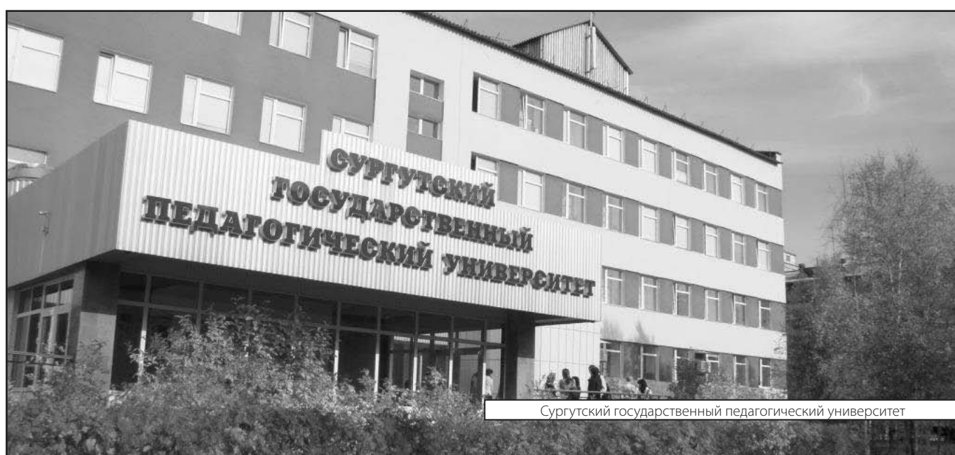
Сургутский государственный педагогический университет

Журнал «Современная наука: актуальные проблемы теории и практики»