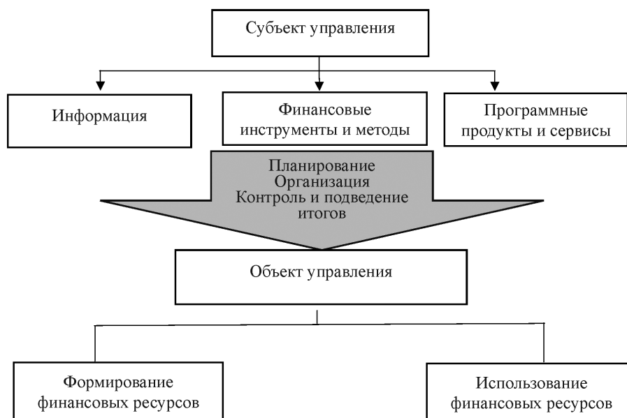
Рис. 2. Система управления финансами