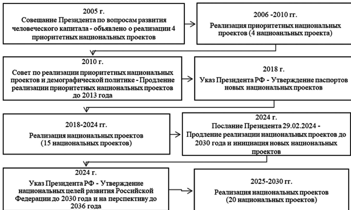
Рис. 1. Этапы развития национальных проектов в Российской Федерации

В своем исследовании Т.А. Першина, Р.Р. Измайлов и А.С. Авилова определили национальный проект как «совокупность мер и инструментов социально-экономического развития государства, обеспечивающих достижение национальных целей и решение проблем на уровне страны» [11].